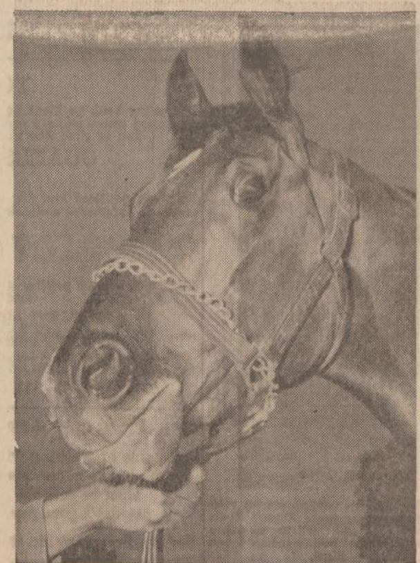
Lucky Debonair - greičiausias arklys Amerikoje. Visi žinojo, kad jis yra geras arklys, bet niekas netikėjo, kad jis galėtų būti pirmuoju. Jis laimėjo $112,000. Kiekvienas juo pasifikięš gaus gražią sumą pinigų. Galia, kad nedaug jų buvo.