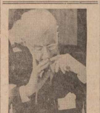
JAV ambasadorius Ellsworth Bunker sako kalbą Amerikos Valstybių Organizacijos atstovams, siūkindamas, kad JAV pasiuntė marinius į Dominikonų respubliką. JAV yra pasiryžusi neleisti ginkluotoms komunistų gaujoms kitoje Pietų Amerikos valstybėje pagrobti valdžią.

Visos Santo Domingo ligoninės yra pilnos sužeistųjų. Sakoma, kad iki šiol Santo Domingo jau žuvo apie 1,000 gyventojų. Dar daugiau jų buvo sužeisti gatvių kovoje. Ligoninėse dirba nemažai Amerikos Taikos korpuso slaugių. Jos gydo ir prižiūri ne tik valdžios kariuomenės, bet ir revoliucionierius.