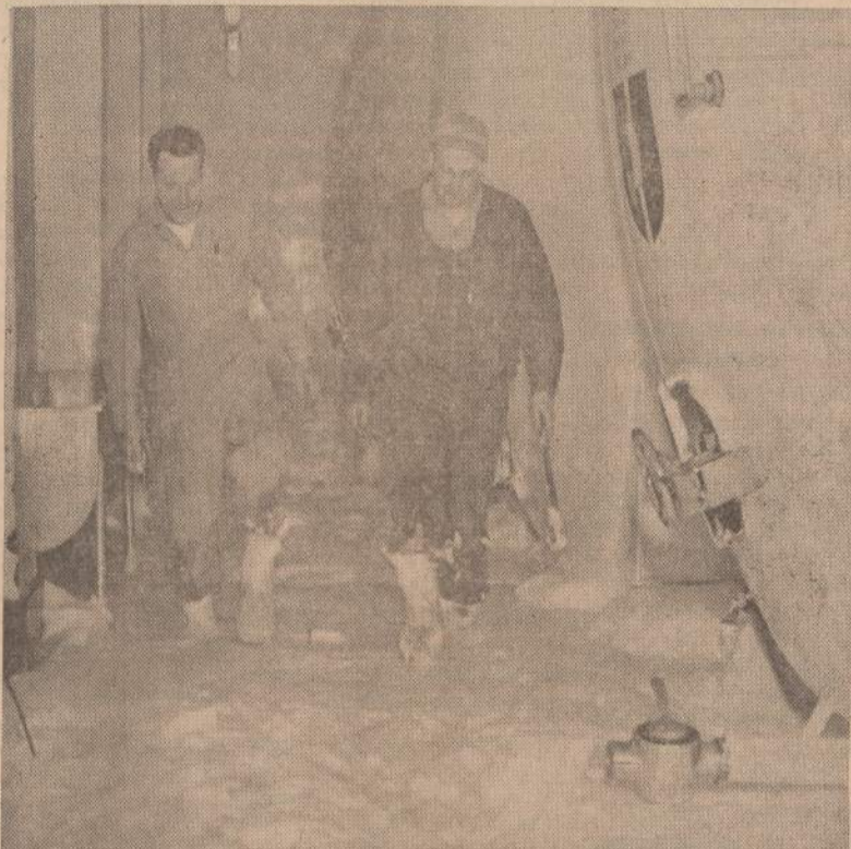
Seattle srityje žemės drebinimas padarė didelių nuostolių namams ir pramonei. Alaus bravori susproginėjo didieji vatai ir paleido rūkstanią brogą. Paveiksle matome darbininkus, braidžiojančius po putojančią alaus brogą. Bravorui padaryta labai daug nuostolių. Daug alučio bus nuleista į Vandens kanalus.

įtempimo ir nuolatinio karo pavojaus, stebėtojų nuomone, Izraelio gyventojai apsisėstų ir krašto stovyboje nepasiektų to, ko jie dabar yra pasiekę. Per paskutinį dešimtmetį Izraelio vaizdas pasikeitė. Nepaprastas dinamizmas pasireiškė visose gyvenimo srityse. Tas galėtų pradams pasiekti tiek daug savo krašto tvarkyme. Jei nebūtų