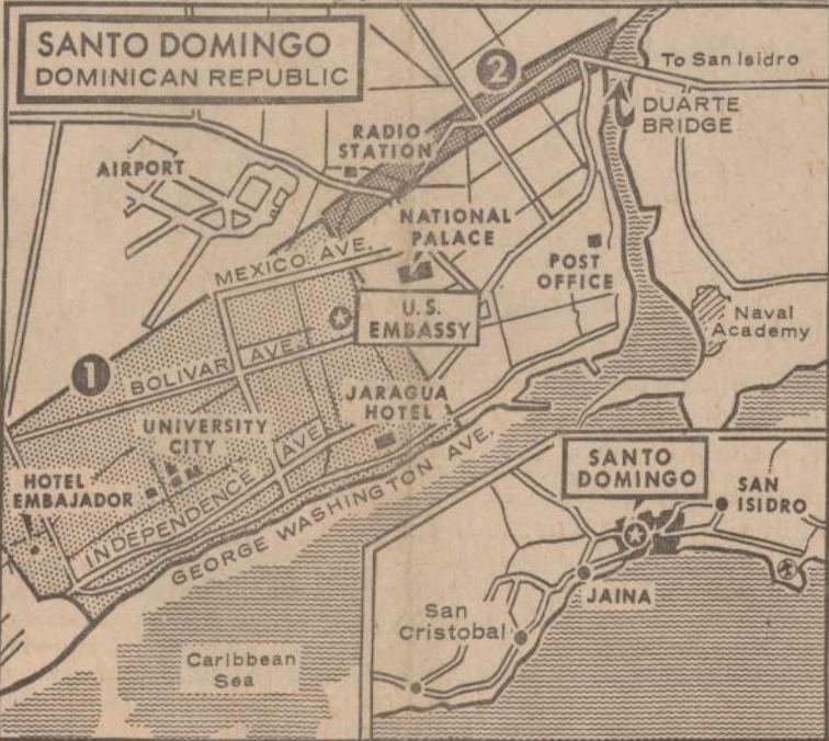
JAV mariniai saugo siaurą Santo Domingo juostą (Nr. 2), kuria siunčiamas maistas ir medicina vakarinėje miesto dalyje (Nr. 1) esantiems domininkonų kariams.

viety Sajunga ir Kuba reikalauja, kad viską spręstų ir tvarkytų Jungtinės Tautos.