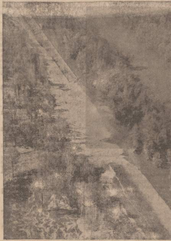
Pakilęs Mississippi upės vanduo pralaužė užtvankas netoli Quincy, Illinois. Upės vanduo užliejo 5,000 akru dirbamos žemės, sunaikindamas pasėlių ir dobius.

Stipendija apmoka visiem metams visas mokslo išlaidas ir primoka pačiam studentui iki $800 jo pragyvenimo reikalams.