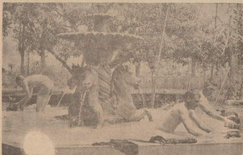
Santo Domingo aikštėje buvo didelis fontanas, kurį JAV marinai naudoja praktikuoti permirkusiems baltiniams praplauti. Karštis ir tvankus oras marinus labiau kankina, negu kovos su triukšmą ufojais.

Prezidentas kvietė visus miestų darbininkus pirmadienį sugrįžti į savo darbus, kad būtų galima atstatyti mieste vandens, elektros ir sanitarijos tiekimą. Be Imbert naujoje valdžioje yra vienas pulkininkas ir trys