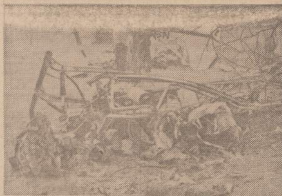
New Yorko valstijoje, netoli Waterloo miestelio lėktuvas taip pat susidūrė su helikopteriu, bet čia gynybos neteko vairuotojas ir jo pavaduotojas.

SKAITYK PĀTS IR PARAGINK KĪTUS SKAITYTI NAUJIENAS