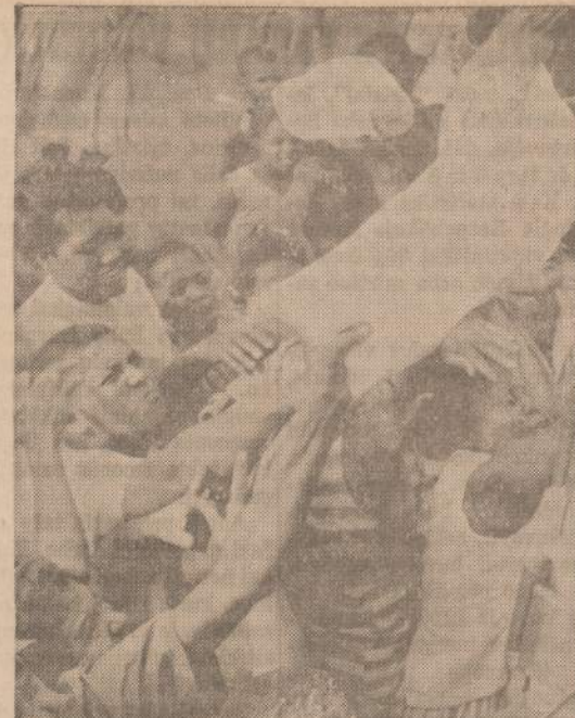
Sukilėlių kontroliuojamas radijas skelbia šmeižtus prieš JAV karą jėgas Dominikonų respublikoje, grasina kovoti prieš amerikiečius ir susidarė ilgiausios gyventojų eilės, kai buvo atvėžtas JAV maistas ir pradėtas dalinti išbadėjusiems gyventojams. Sukilimo metu visa gamyba sustojo, krautuvės išuštėjo.

Mes nedaug tepaisome jų šmeižtu, bet norime, kad nebūtų klaidinami jaunesnieji lietuviai, kurie apie Lietuvos praeitį