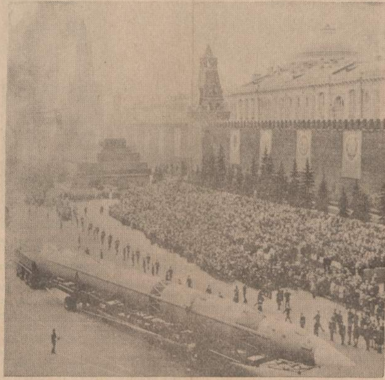
Komunistinė sovietų valdžia Maskvos gyventojams parodė naujausias raketas, pajėgiančias toli pasiųsti sprogstamą medžiagą. Manoma, jog tai yra tos pačios raketos, kurios iškėlė į orbitą sovietų kosmonautus.

Kaltinamasis Wolfgang Lotz ir jo žmona yra laikomi iki teismo kalėjime.