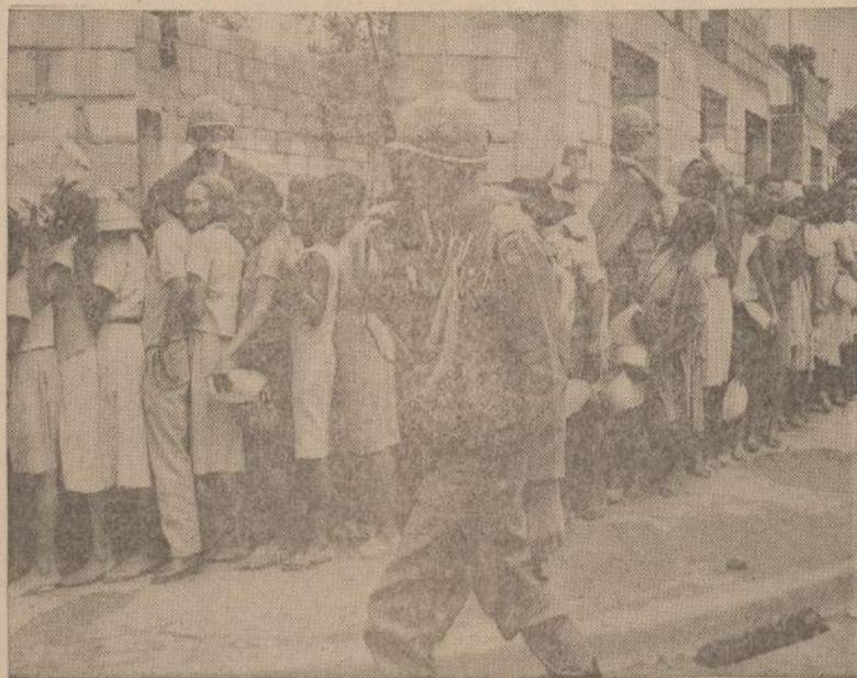
Slapti šauliai tebešaudė į Amerikos marinus, bet Dominikos gyvent. rikiuojasi Ilgiausiom eilėn, kad galėtų gauti amerikiečių paruoštą ir dalinamą maistą. Sukliūtyti kontroliuojamoje srityje trūksta maisto. Visos krautuvis jau išvalytos, žmonės pradeda badauti.

Dekoracijos nebuvo sudėtingos: visuose trijuose veiksmuose tas pats gerai apstatytas kambarys, o scenos gilumoje, vidury — ir kito kambario dalis. Visko užteko, viskas savo vie-