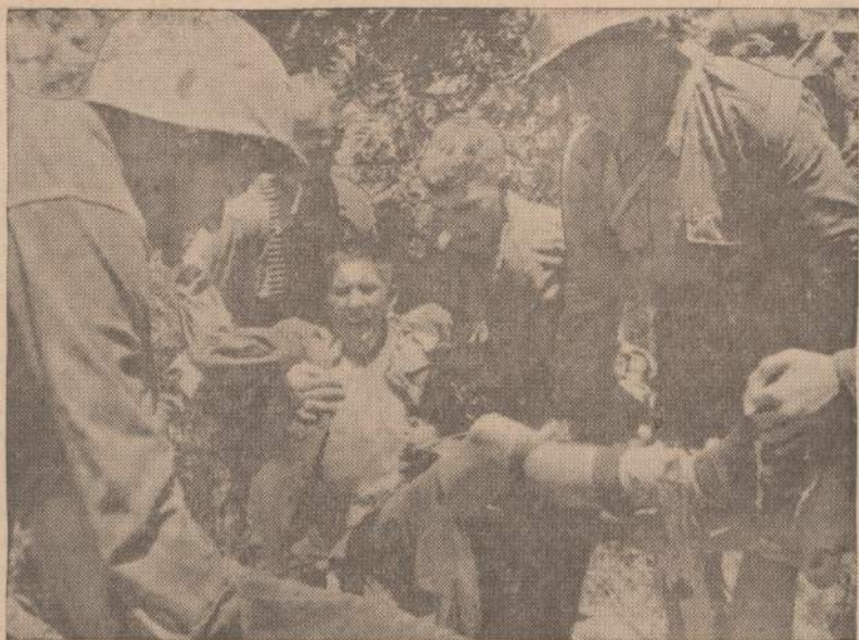
Da Nang aviacijos bazės srityje komunistai pridėjo minų. Jeigu praeivis ar galvijai ant tokios minos atsistoja, tai ji sprosta. Paveiksle matome sargyboms išsivystusią mariną, panašios minos sunkiai sužeista. Kiti jo draugai sužeistąjį deda ant neštuvų, kad galėtų nugabenti į ligoninę.