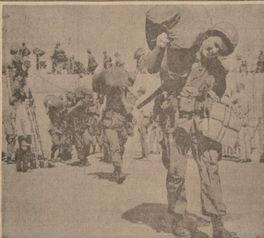
JAV marinai keliai pietų Vietnam, netoli Saigono. Amerikos kariams bus pavesta saugoti aviacijos bazes, kad Vietnamo kariai galėtų pulsti įsiveržusius komunistus.