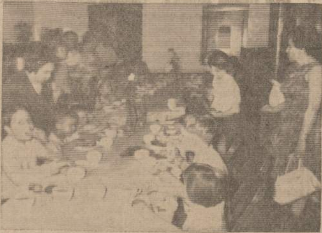
Alvudo Vaiky Teatro aktorių mamytės pratina vaikus prie tvarkingo valgių valgymo.