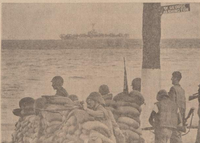
Amerikos kariai, pasidare apsaugas pajūryje, saugo neutralią Santo Domingo zoną. Kelių mylių atstume nuo sargybinių stovi JAV lėktuvnešis Boxer.