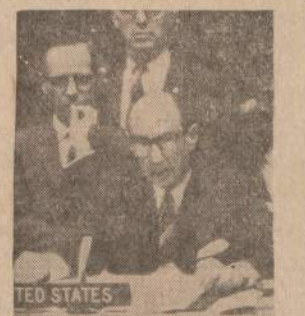
JAV ambasadorius Adlai Stevenson pareiškė Jungtinėms Tautoms, kad Amerikos karo jėgos, šiandien esančios Dominikonų respublikoje, bandys nesuleisti kovojančių dominikonų karo jėgų. Jeigu bus reikalo, tai bus pavartota jėga kovojantiems išskirti. Vyriausiu Amerikos valstybių karo vadu Dominikonų respublikoje paskirtas Brazilijos kariuomenės generolas.

Vienintelis cheminių ikrų blogumas, pasak laikraščio, esąs tas, kad iš jų negalima išauginti žuvų.