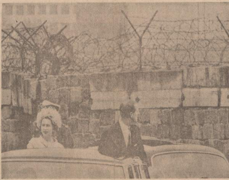
Anglijos karalienė Elzbieta ir josios vyras Pilypas apžiūrėnėja rytų Berlyne komunistų pastatytą gėdos sieną, kad pavergti rytų vokiečiai negalėtų pamatyti, kaip vakaruose jų broliai gyvena.

TOKIJO. — Japonijoje prasidėjo audrų ir tornadų sezonas. Po kelių valandų stipraus lietaus, kilo smarkus vėjas sostinėje Tokijo.