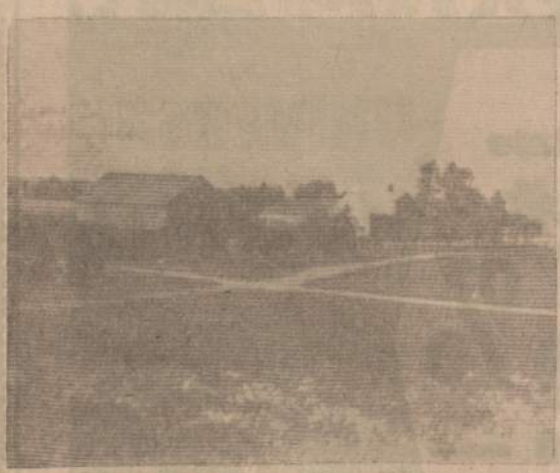
"Siaubingų dienų" autorius yra gimęs ir augęs Mažučių kaime. Taip atrodė Kapacinskų sodybos iki Raudonosios Armijos įsiveržimo, vėliau viskas buvo sunaikinta. Paveikslas trauktas 1939 metais.

Tėviškėje radau visus namiškius, ramiai bedirbančius kasdieninius ūkio darbus. Kažkaip ir mane pagavo šviesesnė nuotaika, matant juos taip rūpestin-