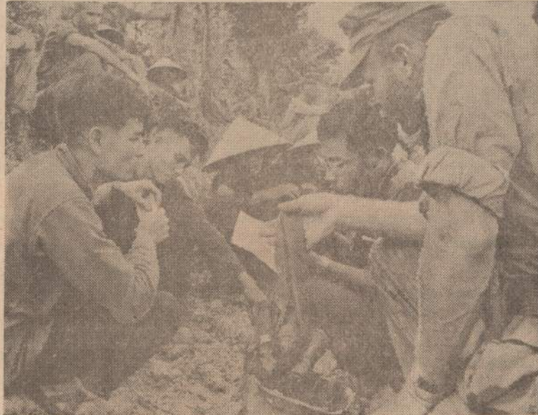
JAV karininkas klausinėja nelaisvėn paimtus Vietnamo komunistus, iš šiaurės įsiveržusius į Pietų Vietnamą. Jis nori patirti, kokių būdu pas juos pateko Rusijoje gamintos granatos. Didokas nelaisvėn paimtų komunistų skaičius labai neįtikinamas, bet yra ir tokių, kurie viską papasakoja.

New Yorką, kad svarbiausi dalykai, kuriuos jis svarstys su prezidentu Johnsonu yra Atlanto pakto ateitis ir Vokietijos bei visos Europos vienybė. Problemos, kurios spaudžia Ameriką yra kartu ir Vokietijos problemos, kurias reikia visiems bendrai išspręsti.