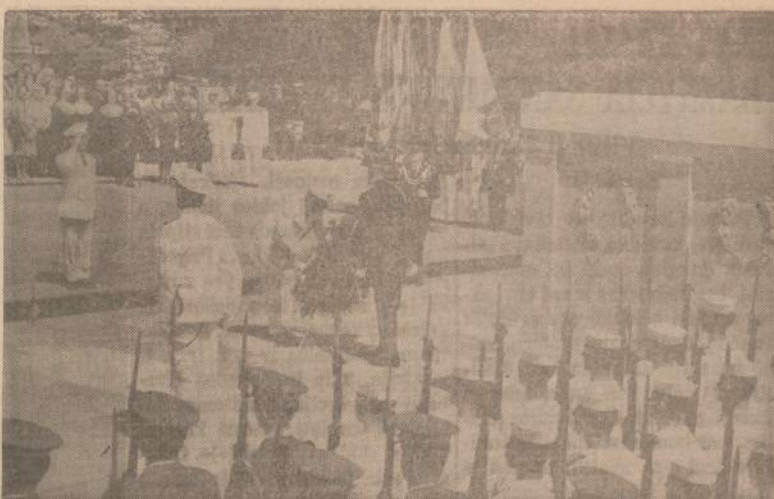
Prezidento Johnsono įgaliotas atstovas, kariuomenės štabo viršininkas gen. Harold K. Johnson, padėjo vainiką prie nežinomo Kareivio kapo Arlington kapinėse. Sekmadienį, Kapų Puošimo Dienos iškilmėse dalyvavo visa eilė aukštų karo vadų.

JAV ginkluota intervencija išgelbėjo tūkstančius nekaltų žmonių gyvasčių ir sustabdė žiaurius mūšius Santo Domingo mieste. Prez. Johnsonas neturi jokio kito tikslotoje nelaimingoje šalyje, kaip tik taikos, kad jos žmonės galėtų išsirinkti savo valdžią ir gyventi ramybeje.