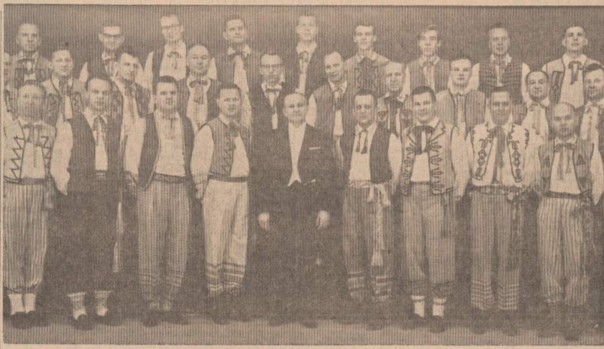
Čiurlionio Ansamblio Vyrų Choras

Kanadoje jau skaitoma lygiai 15 milijonų gyventojų. Didžiausioji religinė organizacija ir čia