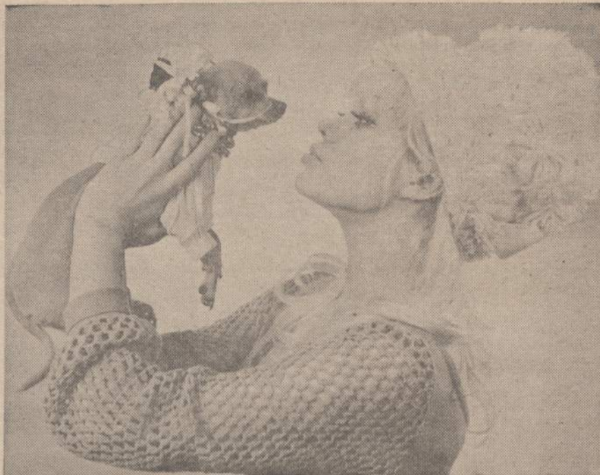
Šokėja ir dainininkė Charo Baez džiaugiasi mažu šunyčiu, nes įsitikino, kad ji tikrai turės progos ištekėti už muziko Xavier Cugat. Nežinia, kuris laimingesnis, šunytis ar šokėja.

— Miškų Departamente yra žuvų ūkio skyrius, jis rūpinasi žuvų ūkiu.