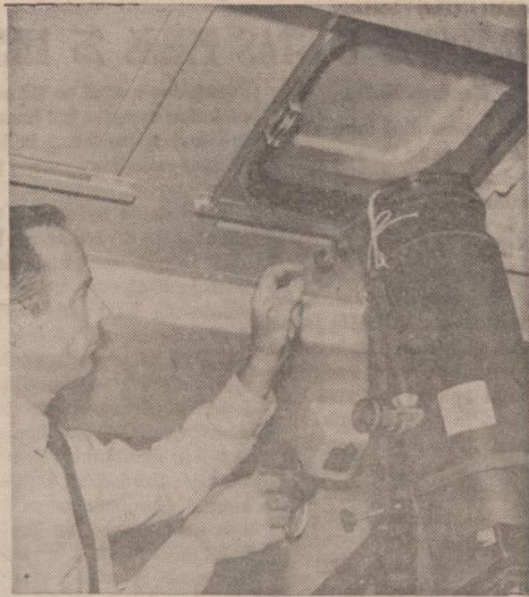
Astronautas Scott Carpenter bando didelį foto aparatą, kuriuo gegužės 30 dieną Pacifike fotografuos saulę. Astronautas skris aukštai iškilusiu lėktuvu, mėnulio šešelyje, kad galėtų nufotografuoti saulės pakraštį. Specialistai tvirtina, kad iš aukštumos fotografijos yra tikslesnės, kelio nepastoją Žemės atmosfera.

Žurnalisto vardas Amerikos lietuviuose nevisai savas, gal ir visai tikrai dėl to, kad dauguma tą titulą dirbtinai savinasi — nieko bendro neturėdami su žurnalistine profesija. Poros metų laiko bėgyje besistengiant žurnalistų sąjungą tremtyje ar emigracijoje atkurti — nebuvo pasiekta jokių konkrečių rezultatų. Tariamoji centro valdyba "išsigimė", pasinešdama į veiklos sritis, visai svetimas žurnalistinei profesijai (organizuojant latvių lietuvių draugiją), o dar geriau savo menkystę pademonstruodama biuletenyje "Lietuvis laikraštinkas išėivijoje". Jei ir sutiktum su kai kuriomis "linijomis (tame biuletenyje išdėstytomis), tai jos negali būti pripažintos kokia nors centro valdybos "tiesa", o tik vieno ar kito jos nario pažiūra į lietuvišką "žurnalistiką" išėivijoje. Pats