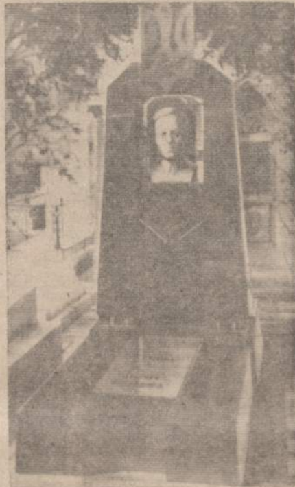
Symono Petliūros kapas Paryžiaus kapinėse