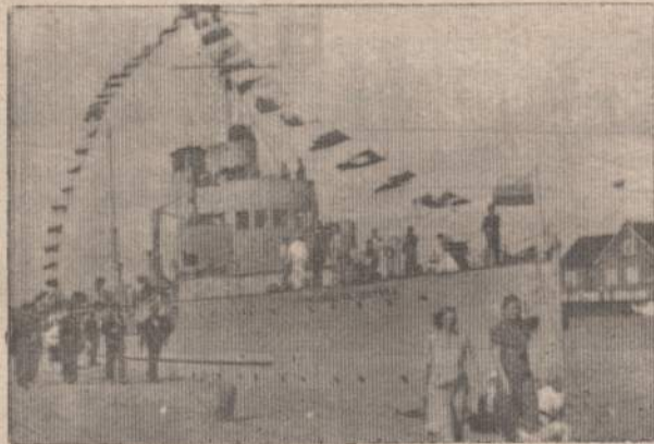
"Prezidentas Smetona" Šventosios uoste 1939 m. gegužės mėn.

Žemsemėms kovojant su smėlio sąnašomis (o jų atsiradavo uosto angoje ir išoriniame baseine po kiekvienos stipresnės audros), Šventosios uostas ėmė tarnauti kraštui ir kaip komercinis uostas. Jamin įplaukdavo mažesni jūros laivai ir pasikraudavo eksportuojamų prekių