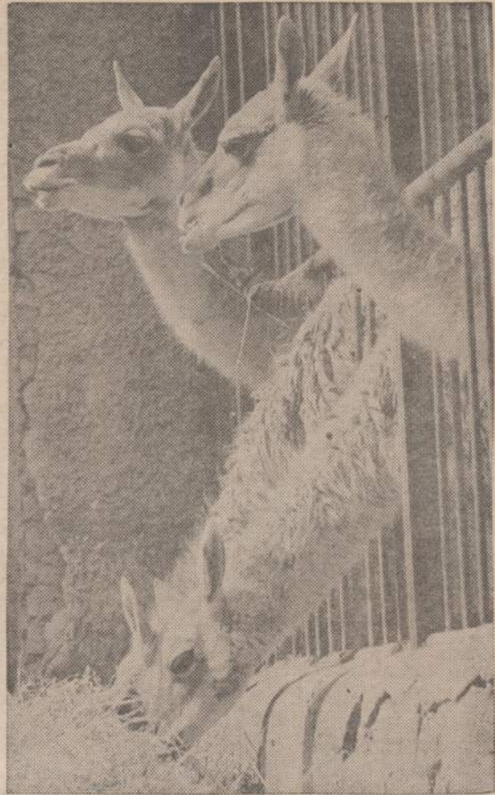
Romos zoologijos sode yra keturi labai gyvi gaunakai. Lankytojams jie labai patinka, šimtai stovi prie jų narvo.

pojus tarnavo rusams prieš pirmą pasaulinį karą okeaninio tipo laivams priimti vien tik dėl nuolatinio žemsemių gilinimo darbo, kaštavusio didelių pinigų. Nepriklausoma Latvija tokių išlaidų pakelti negalėjo ir jų laikais (bent iki II pasaulinio karo pabaigos) negalėjo uosto sename maštabe naudoti. Ką bekalbėti apie Šventosios uostą.