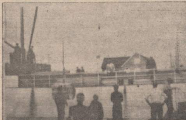
1939 m. birželio mėn. olandų laivas Reze krauna piauto miško medžiaga.