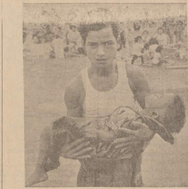
Don Xoi srityje komunistai užpuolė vietnamiečių kaimelį ir išžudė daug žmonių. Jaunas vietnamietis neša komunistų sužeistą savo sūnelį.