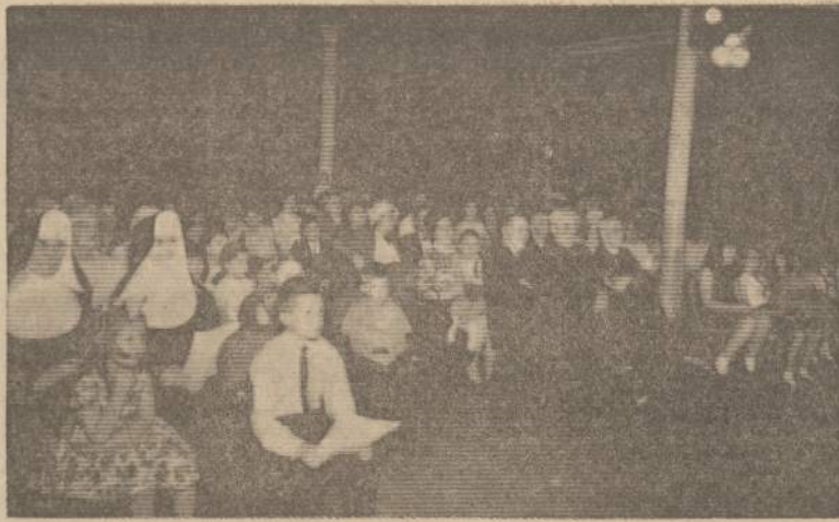
Alvudo Vaikų Teatro išvykai į Cicero, III. Žiūrovai vaidinant A. Žalinkevičaitės "Aliuotės Sapnas".

Piligrimai musulmonai keliauja į Meką iš viso pasaulio — daugelis jų jau seni ir susilpę. Mažiausiai saulės smūgiu susirgo 1961 metais (0.036 iš 1,000) iš Saudi Arabia vidurio atkeliavusieji piligrimai. Taip pat mažai saulės smūgio atsitikimų buvo iš tropiškų kraštų atkeliavusiųjų tarpe. Daugiausia saulės