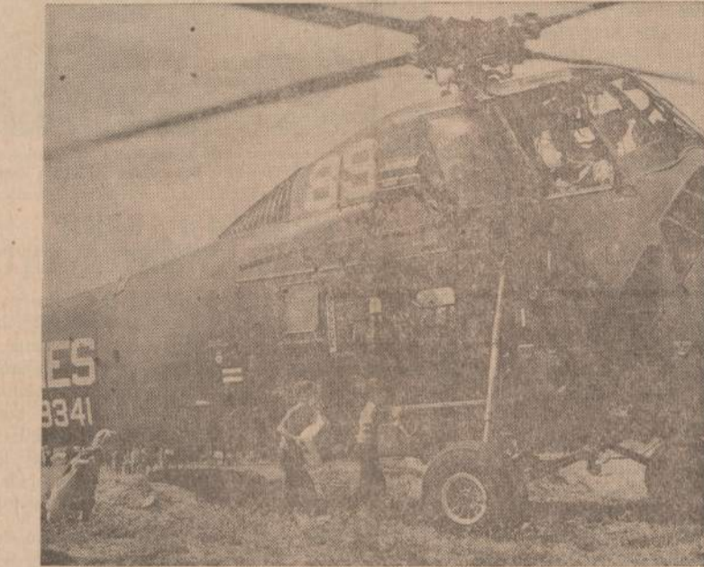
Prasidėjus tarpusavėms kovoms dominikonų respublikoje, visa eilė užsieniečių buvo išvežti iš pavojingesnių vietų. Paveiksle matome JAV helikopterį, vežantį į laivą vaikus. Jie domisi aplinka, bet idomiausias jims yra pats helikopteris.

BONA. — Bruselyje susirinko šešių Europos kraštų ekonominė taryba aptarti visų Bendrosios Europos rinkos kraštų žemės ūkio kainų suvienodinimą. Prancūzija reikalauja kainas suvienodinti dar šiais metais, o Vokietija norėtų palaukti dar metus laiko, kol bus suderinti kiti klausimai tarp šešių valstybių. Prieš suvienodinant žemės ūkio produktų kainas, vokiečių nuomone, reikėtų suvienodinti prekybos, mokesčių ir kai kurių pramonės šakų gaires.