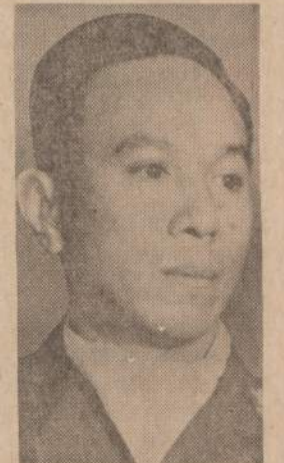
Nguyen Van Thieu yra vyriausias Vietnamo vyriausybės atstovas. Atstatydamas vyriausybę, buvo sudaryta 10 karių komitetas, kuris perėmė krašto valdžią iki karo pabaigos. Išlaisvinus kraštą, bus praveisti rinkimai ir valdžia vėl perduota civiliams. Van Thie yra karių sudaryto komiteto pirmininkas.