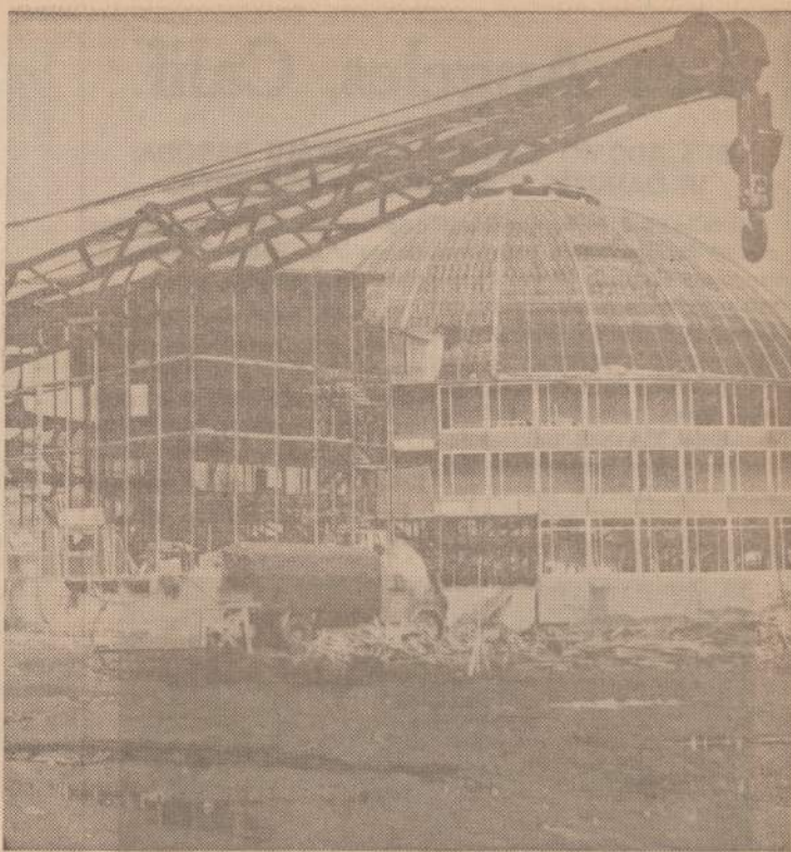
1963 metais Jugoslavijoje, Skolpje srityje įvyko didelis žemės drebėjimas, išgriovęs beveik visą miestą. Pamažu miestas atstatinijamas. Pavelsio matome statomą naują miesto salę.

Egzilyje atsikūrus Vlikas, he kitų atliekamų ar atliktinų už-