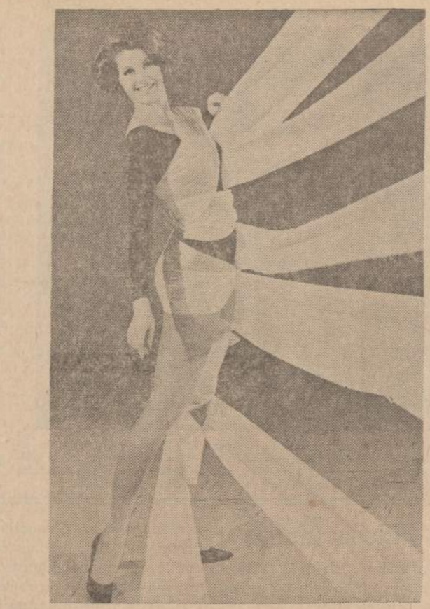
Dabar pradėjo gaminti popieriu, atstojantį audinius. Metmenys yra stiprių medvilnės siūlų, o ataudai yra popieriniai. Moteris parodo, koki stiprus yra šie gaminiai. Lankstumas ir pritaikomumas yra labai didelis. Jų kaina yra maža, palyginus su audinių kainomis.

Montrealyje įvykusioje JAV-Kanados konferencijoje aptarti, kaip padanginti vandens