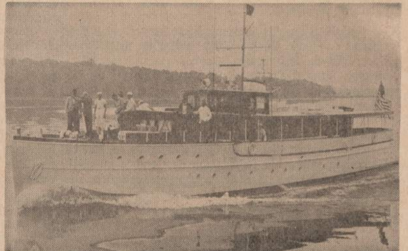
Prezidentas Johnson pareiškė, kad jachta "Honey Fitz" jam bus nereikalinga, bet paskutiniu metu jis ne tik ją naudojo poilsui, bet kartais pakviečia kelionėn atsakingus pareigūnus ir joje posėdžiauja.

SKAITYK PATS IR PARAGINK KITUS SKAITYTI NAUJIENAS