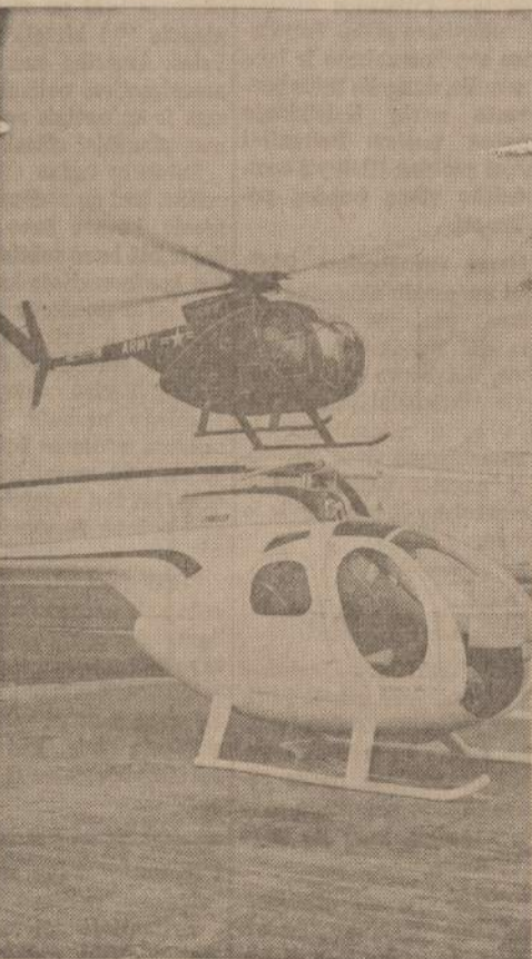
Paveiksle matome du helikopterus. Viršuje matome paprastą stebėjimo helikopterį, o apačioje stovi greitai skraidyti galintis lūksusinis helikopteris, labai parankus didelių bendrovių atsakomingsiems pareigūnams.

"NAUJIENOS" KIEKVIENO DARBO ŽMOGAUS DRAUGAS IR BIČTULIS