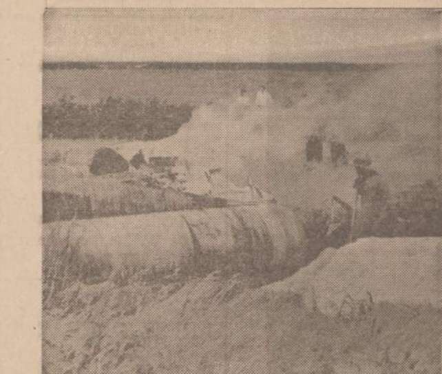
JAV karo lėktuvas, atskridęs į Paryžių, kad galėtų dalyvauti naujų lėktuvų pasirodyme, besileidžiamas nukrito ir sudužo. Vienas lakūnas buvo vietoje užmuštas, o kiti du sunkiai sužeisti. Lėktuvas, beliesdamas žemę, sudužo ir užsiliepsnojo. Tūkstančiai žmonių matė Amerikos lėktuvo nelaimę.

— Autobusas į Balso Pikniką, sekmadienį, birželio mėn. 20 d. į Bučo sodą, Willow Springs, Ill. Pirmas sustojimas 12 val. 30 min. prie 18-tos ir Halsted, iš čia į Bridgeportą prie 33-čios ir Lituania, toliau į Town of Lake, prie 45-tos ir Hermitage, į Brighton Park, prie 45-tos ir Fairfield ir Marquette Parke prie 69-tos ir Washtenaw. Iš pikniko, 7 val. autobusas tą pačią tvarką grįš atgal. (Pr.)