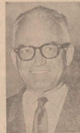
Barry Goldwater, buvęs respublikonų partijos kandidatas į prezidentus, pareiškė, kad jis kandidatuos į senatą. Jis nori vesti kovą su 87 metų sulaukusiu demokratų senatorium Carl Hayden.

PARYŽIUS. — Prezidentas de Gaulle važinėja po Prancūziją, sakydamas priešrinkimines kalbas. Jis visose kalbose pabrėžia, kad Prancūzijos likimas esąs išlaikyti Europos balansą prieš dvi galybes—Ameriką ir Sovietų Sąjungą. Tai atlikti Prancūzija galėsianti tik tada, jei ji turės pastovią ir stiprią vyriausybę. De Gaulle aiškiniu, po antrojo pasaulinio karo iškilo Amerika ir Sovietų Sąjunga tik todėl, kad kitos valstybės, kurios praeityje galėdavo šias galybes atsverti, karo pasėkoje buvo laikinai susilpnintos.