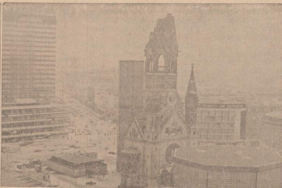
Berlyne pastatė 20 aukštų namą, kurį pavadino Europos Centru, mažą kairėje. Ant stogo bus mažas sodelis, o pačiame pastate tilps bent 100 modernių krautuvių. Paveikslas centre matome kaizerio Vilhelmo statytą bažnyčią.

tis kalbėję apie Dievą", pataria Newtono teologijos mokyklos Andoveryje profesorius asistentas Harvey Cox, skaitomas vienu iš Amerikos radikaliausių ir labiausiai respektuojamų jaunųjų krikščionių galvotojų. Beje, jis yra protestonų ministeris, Vatikano II Santarybos nusistatymu kunigams lygus brolis, kurio galvosenos sveika pasiklausti.