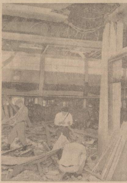
Komunistams pavyko padėti bombą Saigono aerodrome. Sprogimo metu buvo sužeisti keli JAV kariai ir Vietnamo policininkai. Iki šio mėto nepavyko suimti bombos nešėjų.

Britanijoje dėl tos pat priežasties OBM ordina sugrąžino karalienei senas karo veteranas, kuris pasisakė nemorj būti toje pat klasėje su Beatles.