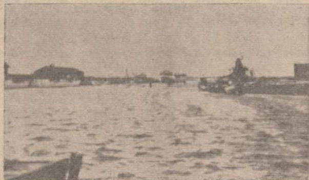
Šventosios uosto vidaus baseinas 1939 m. gegužės mėn.