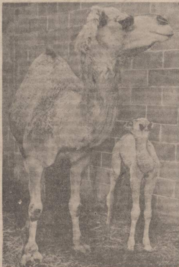
Wisconsinso Zoologijos sode kuprius susilaukė dukters. Paveiksle matome motiną ir vienos savaitės vienakuprę dukra. Madison mieste suaugusieji ir vaikai eina į sodą naujagimio aplankyti.

Verdi "Requiem" nėra mums nei artimesnis, nei lietuviškesnis už Sasnausko kūrinį, dargi,