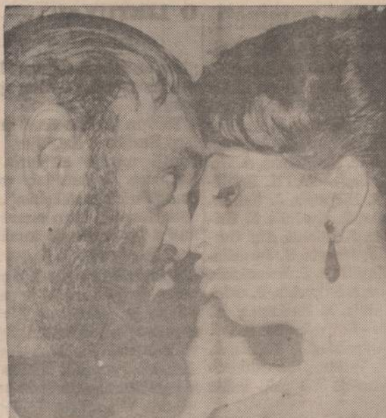
Artistai Liza Minelli ir Zero Mostel gavo pažymėjimus už nepaprastai gerus pasirodymus scenoje. Iš džiaugsmo įjėdu trina nosis, kad ir toliau jiems taip sektųsi vaidinti.

Už tai visos motinos renkimės būti gerais draugais saviems ir