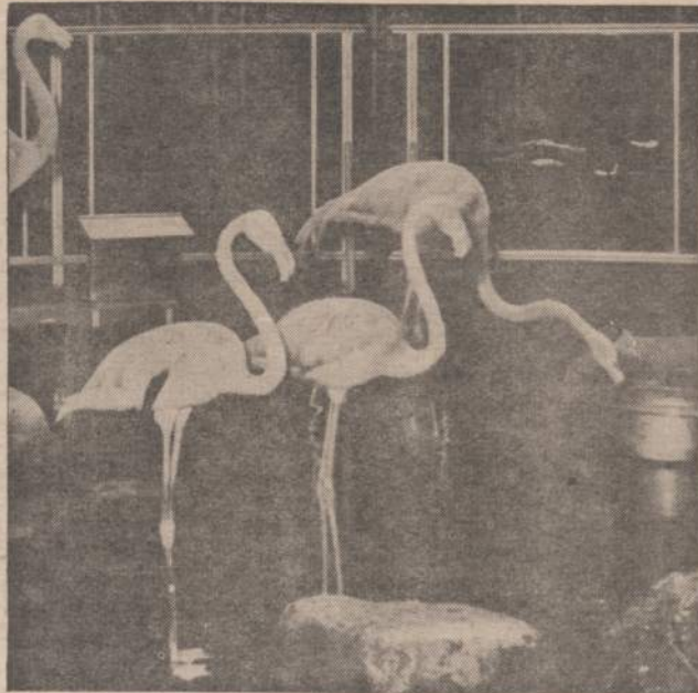
AMERIKOS FLAMINGAI LINKOLNO PARKE