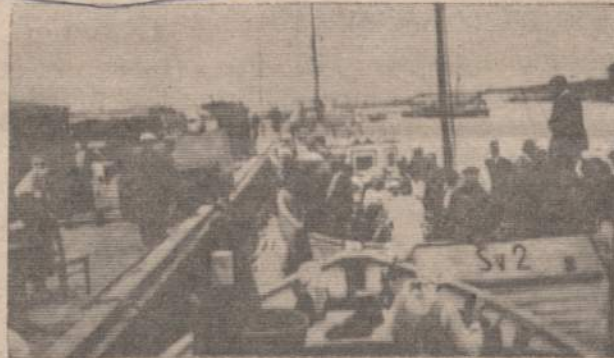
Šventosios žvejų kuteriai grįžta iš žvejybos 1938 m. vasarą.