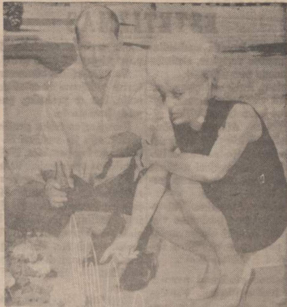
Dr. Samuel Sheppard ir antroji jo žmona laukia apeliacijos teismo sprendimo. Dr. Sheppard nubaustas kalėjimu už pirmos žmonos nu- žudymą. Būdamas kalėjime, jis pradėjo susirašinėti su vokietau, kuria vėliau vedė. Dabar Dr. Sheppard kreipėsi į teismą, prašydamas leisti jam būti laisvėje, kol aukštesnieji teismai dar kartą galės jo by- lą peržiūrėti. Teisėjas liepė nubaustam daktarui grįžti į kalėjimą.