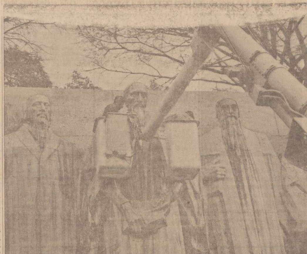
Šveicarijoje, Zenevoje, yra pastatytos kelios stovylos ten gyvenusiems garsiems vyrams pagerbti. Ten stovi Farello, Calvino, Bežės ir Knox stovylos. Praeitį savaitę piktadariai jas aptaškė dažais. Dabar miesto darbininkams reikia juos valyti.