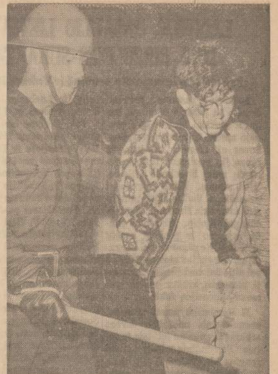
New Hampshire policija griebia kiekvieną jaunuolį, kuris atvyko į motociklistų lenktynes ir pradėjo daryti įrengimus. Naujai priimtas įstatymas draudžia naikinti turta. Policijai įsakyta griežtai elgtis su triukšmaujančiais jaunuoliais. Teisme jiems bus paskirtos žymiai didesnės baudos.