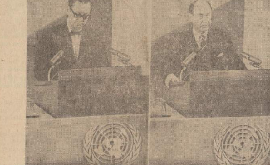
Sovietų atstovai Fedorenkai (kairėje) labai nepatiko prezidento Johnsono Jungtinėse Tautose pasakytoji kalba. Kairėje matomas Adlai Stevenson pareiškė, kad Sovietų Sąjunga Vietnamo reikalų, vietoj pulsti JAV, galėtų padaryti žymiai daugiau taikai įgyvendinti. Ji galėtų sustabdyti karo įėgų siuntimą į Pietų Vietnamą.

sinimo vienam mėnesiui uždaryti visus laikraščius. Ky tikisi, kad tą priemonių nereikės, kad laikraščiai leidėjai savanoriškai sumažins laikraščių skaičių.