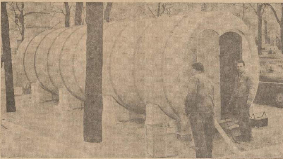
Gen. Charles de Gaulle Pacifike sprogdina atomo bombas, o Paryžiuje stato paveiksle matomas slėptuves nuo atominės bombos pasekmių. Apskritame pastate 9 žmonės gali išgyventi devynias dienas.