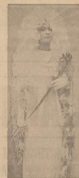
Iki šio mėto nuotakoms uždėdavo rūtų vainikėlių ant galvos, bet dabar prancūzai pradėjo vartoti paveikles motam didelį paruką. Kelios panos taip jau buvo pasidabinusios, bet kitoms tokia naujovė nepatinka.

Ne persivalgymas ir ne pasninkas, bet tvarka Klausimas: Mudu su draugu ginčijamės kas yra geriau — ar pasninkas ar stiprus užkandis? Kaip jūs pasakytumėt? Atsakymas: Hipokratas dar prieš Kristų tvirtino, kad nei maisto perteklius besimaitinant, nei pasninkavimas nėra geri dalykai; mat, nė vienas veiksmas nėra sveikas, kas peržengia gamtos reikalavimus.