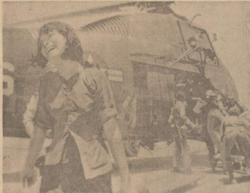
JAV ir Vietnamo karo jėgos helikopteriais iš karo lauko išveža civilius gyventojus. Paveiksle matome vietnamietę, kurios vyras užpuolusių komunistų buvo nužudytas.

Kinijos spaudos agentūra aprašydama Jugoslavijos prezidento Tito lankymąsi Sovietų Sąjungoje, sako, kad Kremliaus vadai parūpino Tito tribūną, iš kurios "jis galėjo parduvinėti suos revizionizmo prekes ir puliti broliškas Markso-Lenino partijas."