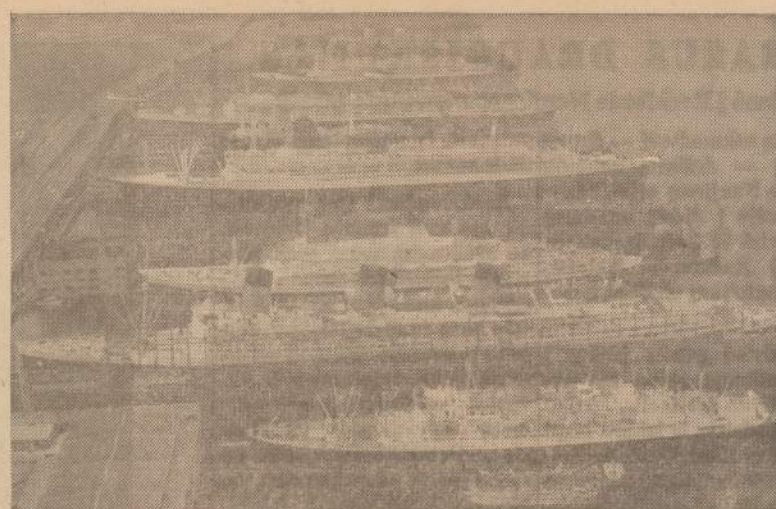
Didžiausieji pasaulio laivai New Yorko uoste. Antra liepos savaitę laivais atplaukė daug europiečių, o iš JAV išplaukė 9,000 turistų. New Yorko stovi parišti britų, prancūzų, italų ir vokiečių keleiviniai laivai.

Jeigu įsigilinti į cigarečių dalinimo reikalą, tai galima prieiti įvairių išvadų: jeigu UNRRA mums nesutiko duoti bent kokių dokumentų, pagal kuriuos galima būtų nustatyti, kiek mūsų stovyklai buvo skirta cigarečių, tai, reikščiau, ir pačioje UNRRos įstaigoje turėjo būti ne viskas tvarkoje; antra, negalima tikėti ir įrašams knygoje, jeigu nėra pateisintam dokumentų. Taigi galima daug ką pasakyti ne tik apie stovyklų komitetus, bet ir apie pačią UNRRą. Kiek man žinoma, dauguma UNRRos tarnautojų atvažiavo į Vokietiją beturčiai, o UNRRai baigus savo veiklą, išvažiavo, jeigu ne turtuoliai, tai bent pasiturį. Ne