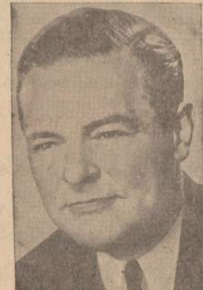
Henry Cabot Lodge

Washingtono kalbama, kad paskirdamas žymų respublikonų partijos narį ambasadoriumi Pietų Vietname, prezidentas norėjo užtikrinti sau namie respublikonų partijos pritarimą. Tačiau, kiek matome kongrese, respublikonai ir dabar per daug nekritikuoja prezidento politikos.