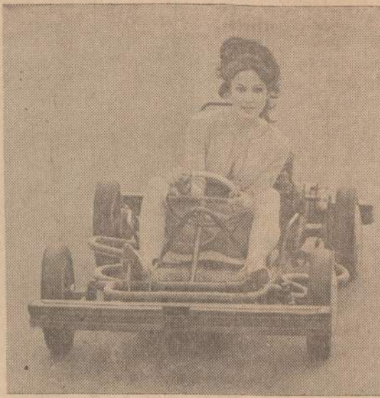
Gana gražios išvaizdos Paulė Prentiss turi dalyvauti automobilių lenktynėse. Paveiksle matome vieną naujai sukamo filmo vaizdą.