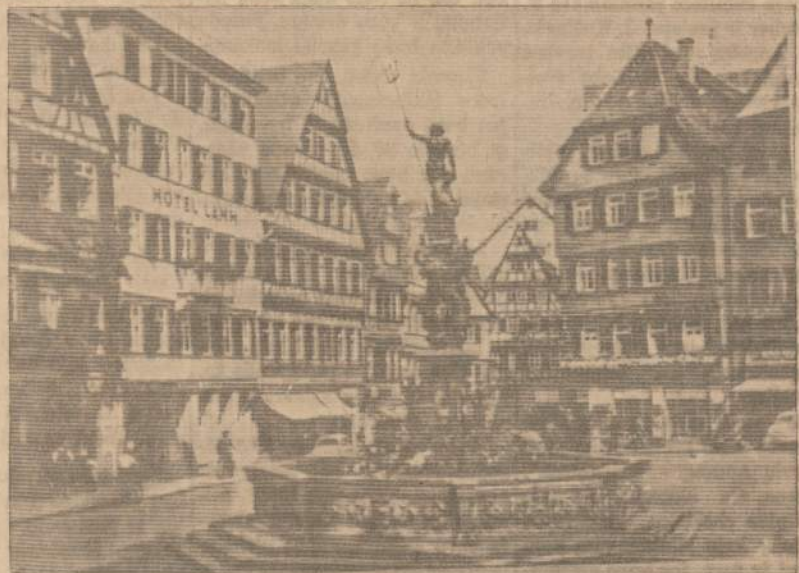
Karo metu tūkstančiai lietuvių laikiną prieglaudą buvo suradę Tuebingeno mieste. Paveikslė matome Tuebingeno rinką su viduryje stovinčiu ir tridantį laikinųjų senovės dievu.

SKAITYK IR KĪTAM PATARK SKAITYTI "NAUJIENAS"