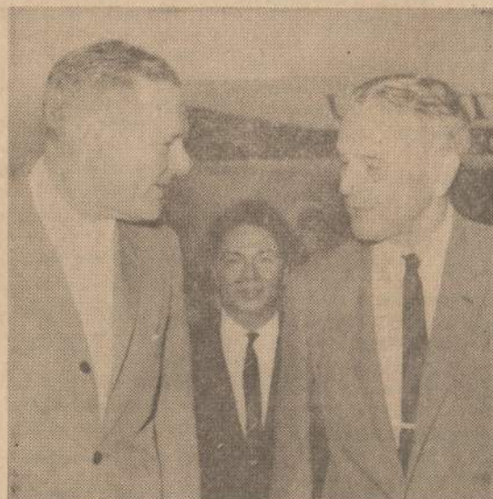
Praeitais metais Henry Cabot Lodge perdavė JAV ambasadoriaus pareigas Saigone gen. Maxwell Taylor. Praeitą savaitę prezidentas Johnsonas ir vėl paskyrė Cabot Lodge ambasadoriaus pareigoms.

— Pabaltiečių organizacijos kreipėsi į J. Tautų delegacijas, prašydamos iškelti sovietinio kolonializmo klausimą bei paremti pabaltiečių laisvą tautų apsisprendimo klausimą.