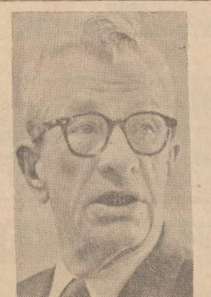
Illinois senatorius Everett Dirksen praeitą savaitę praleido Washingtono ligoninėje. Jam vis dažniau pradeda skaudėti viduriai. Gydytojai tvirtina, kad respublikonų vadas senatė šią savaitę galės sakyti kalbas ir vadovauti politinei kovai.

VANCOUVERIS. — Kanados aviacijos ekspertai neabejoja, kad keleivinio lėktuvo nelaimė, kurioje žuvo 52 asmenys, buvo sukelta lėktuve sprogdusios bombos.