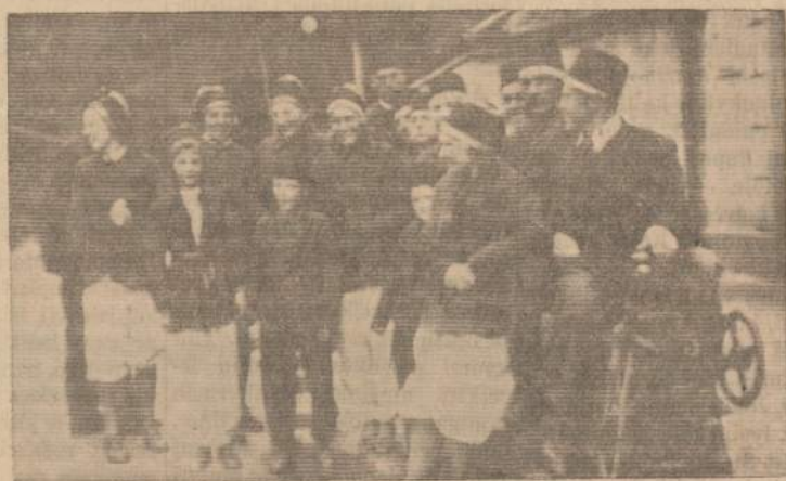
Karo veiksmams praėjus Vokietijoje, lietuvių tremtinių grupė buvo nuvažiuavusi į vokiečių druskos kasyklas. Paveiksle matome kasyklos lankytojų grupę.

SKAITYK IR KITAM PATARK SKAITYTI "NAUJIENAS"