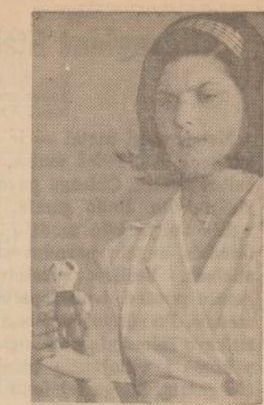
Prezidento dukte Luci Baines Johnson vasaros metu dirba akių klinikoje. Mažiams vaikams ji parodo žaislelį, kad galėtų norima kryptimi nukreipti vaikų akis. Luci sukėlė tikybinkų ginčus, kai šiomis dienomis iš vienos tikybines organizacijos perėjo į kita.

Užrašas šioms dviem lakūnams Marquette parke pastatytame paminkle yra paimtas iš jų testamentų. Ten skaitome, lietuviškai: "Šį savo skridimą mes skiriame ir aukojame tau, jaunoji Lietuva" (ne "jaunieji lietuviai", kaip reporterio parašyta).