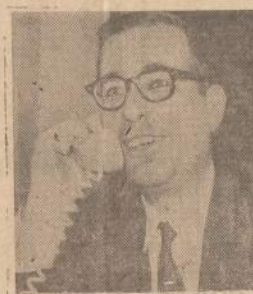
Atsistatydinus aviacijos sekretoriui Eugene M. Zuckert, prezidentas Johnsonas paskyrė Dr. Harold Brown aviacijos sekretoriumi pareigoms. Dr. Brown jau užėmė savo stalą apsaugos departamente, nors senatas jo dar nepatvirtino šioms pareigoms.

♦ Britų parlamento narys Davies, kuri britų vyriausybė buvo pasiuntusi į Šiaurės Vietnamą pasimatyti su komunistų vadais, jau grįžta namo. Manoma, kad jo tikslas prikalbinti Vietnamo komunistus siekti taikingo susitarimo, — nepavyko.