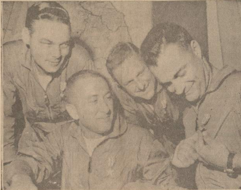
Keturi JAV aviacijos kapitoniai, gavę medalius už rusiškų lėktuvų numušimą. Poros minučių laikotarpį šioms keturiems vyrams pavyko nušauti du sovietų karo lėktuvus šiaurės Vietname

♦ Valstybės departamento pasekretorius Ball pareiškė Paryžiuje susirinkusiai Nato konferencijai, kad Amerika tol teiks paramą Pietų Vietnamo vyriausybei, kol komunistai sustabdys savo agresiją ir parodys norą derėtis dėl krašto ateities.