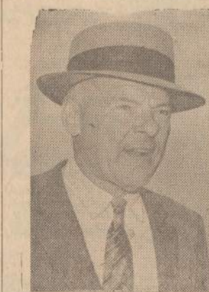
Henry Cabot Lodge, naujasis JAV ambasadorius Vietname, atvyko į Washingtoną, kad galėtų išsikalbėti su prezidentu Johnsonu apie jam paskirtas pareigas Vietname.

LA PAZ. — Bolivijos prezidentas pareiškė, kad kelios užsienio valstybės siekia sugrąžinti Bolivijos valdžion buvusį prezidentą Victor Paz. Jis pridėjo, kad Bolivijos kariuomenė šito neileisianti.