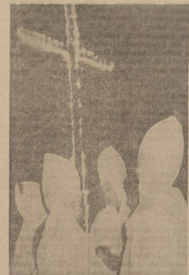
Fort Lauderdale, Fla., mieste tyje buvo suvažiuę pietinių valstybių kuklukai ir kuklukai. Buvo pasakytos labai griežtos kalbos, o vėliau sugedintas 35 pėdų kryžius. Kryžiaus deginimo ceremonijoje dalyvavo daugiau pustrėčio tūkstančių žmonių.

TREČIADIENI visą dieną uždara. KETVIRTADIENI . . . . . 9:00 A. M. — 8:00 P. M. PENKTADIENI . . . . . 9:00 A. M. — 8:00 P. M. SEŠTADIENI . . . . . 9:00 A. M. — 12:30 P. M.