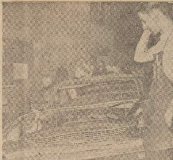
Paskutinėmis dienomis Chicago miesto centre vyksta įvairūs sproginių imai. Policijai dar nepavyko nustatyti, kas sprogdinama medžiaga paruošia ir kokį yra sprogdintojų tikslai.