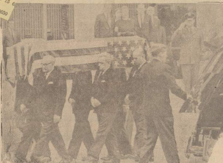
Vėliava uždengta ambasadoriaus Adlai E. Stevensono karstas iš JAV ambasados išnešamas automobiliu. Keturvietinio vakarą jis buvo nuvežtas į Washingtoną, o šeštadienį pervežtas į Springfieldą, Ill. Bus palaidotas pirmadienį.