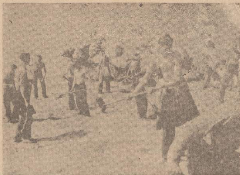
Prancūzijos pakrastyje stovis JAV lėktuvneis paleido į jūrą 3,000 galionų juodo, jau mažiau varfuto aliejaus. Jūros bangos tą aliejų atnešė į Cannes pakraštį ir užteršė pakraščiu smėlį. Amerikos laivyno vadovybė pasiuntė marinius pakraščius nuvalyti, o du transporto laivai atvilko į Cannes šviežio ir švaraus smėlio.