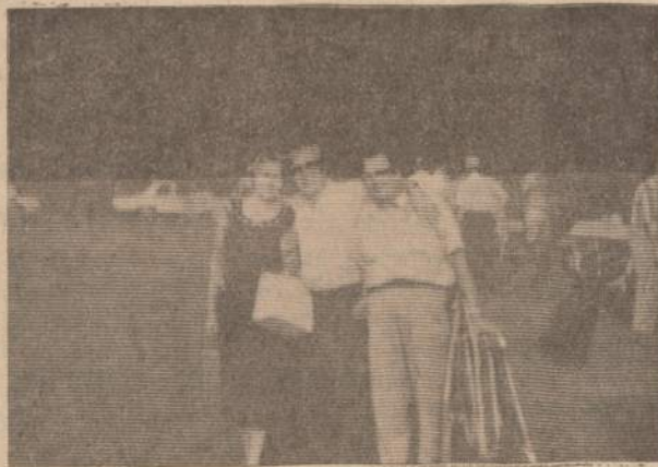
Eisim brolieliai namo...