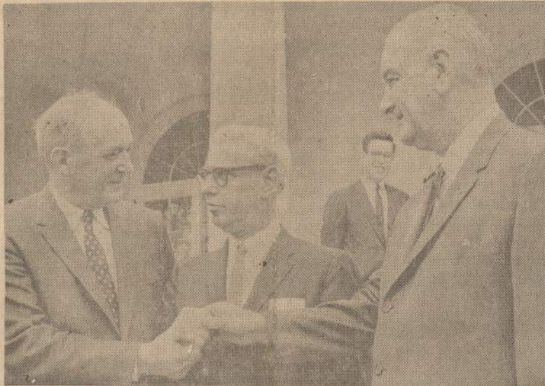
Sekretorius Dean Rusk sveikina teisėją Arthur J. Goldberga, kai prezidentas Johnsonas paskyrė jį JAV ambasadoriu prie Jungtinių Tautų. Prezidentas įsakė naujai paskirtam ambasadoriui glaudžiai bendradarbiauti su sekretorium Rusk.

340 sužeistais. 155 dingo ar buvo paimiti belaisvėn. Komunistų žuvo 419 ir 28 paimiti belaisvėn.