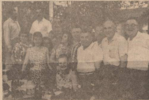
Dalis deinojuojančio stalo