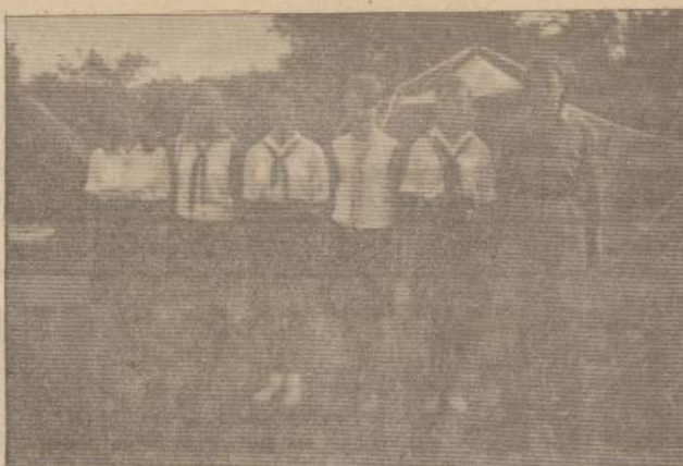
Mergelių "mišky susių" stovyklos vadovybės.

Argentinios Lietuvių Centras pasiruošęs įrengti sporto aikštelę. Tam reikaliu įvairiomis progomis renkamos aukos. Kiekvieną sekmadienį ruošiamos aikšte-