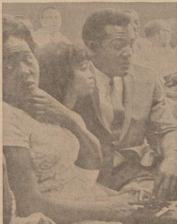
Geriausias Clevelando žaidėjas Jim Brown sėdi teisme su žmona ir motina ir laukia sprendimo. Jį kaltino mergaitės užpuolimu viešbutyje.

VISI LIETUVIAI BIZNIERIAI SKELBKITĖS NAUJIENOSE