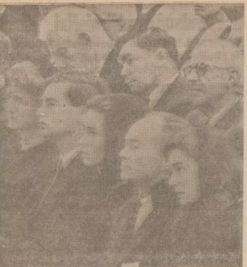
Bloomington, Ill., kapuose atsisveikinimo kalbos klauso Adlai E. Stevenson sūnūs ir marčios. Uipakalyje sėdi senatorius Paul Douglas. Adlai E. Stevensonas buvo palaidotas pirmadienio rytą.

Lietuvių katalikų vadai turėtų suprasti, kad popiežius Jonas XXIII pirm negu rašęs encikliką apie pasaulinę taiką, turėjo parašyti encikliką apie katalikiškų tautų sugerinimą ir įkūrimą jų tarpe krikščioniško suvienymo. Popiežius Povilas VI, užuot keliašes į pagonišką Indiją, privalėjo keliauti į šiaurės Italiją, į Tirolį, kur pusė milijono vokiškai kalbančių austrų prijungti prie Italijos ir italijoninami. Dėl to ten dideli piktučiai tarp tų tautybių. Austrai