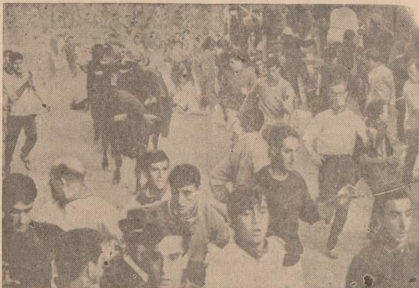
Ispanijoje, Pamplonos mieste šv. Fermino šventės metu, kai ruošiamas didžiausias rungtynės su buliais, vaikai bėgioja miesto gatvėmis, kai buliai varomi į areną.

A. TVERAS LAIKRODŽIAI IR BRANGENYBES Pardavimas ir Taisymas 2646 WEST 69th STREET Tel. RPublic 7-1941