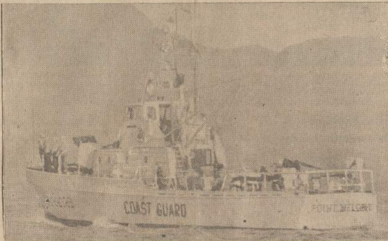
Į Vietnamo vandenį atplaukė JAV pakrančių sargybinis laivas "Point Welcome". Jis pasiekė Dan Nang bazės srį. Atplaukęs laivas turi visus radaro įrengimus pakrančių judėjimui kontroliuoti. Komunistų laivai jau negalės jūromis vežti ginklų sukiliėjams.

WASHINGTONAS. — Prezidentas Johnsonas nutarė įsteigti ambasadoriaus Adlai Stevenso nom atminimui fondą, kuris mokėtų stipendijas jaunuoliams, kurie nori dirbti Jungtinių Tautų organizacijose.