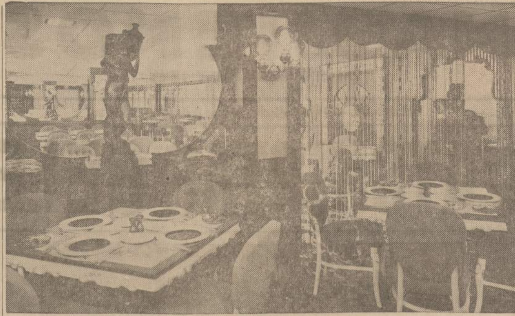
Houston mieste Texas bizieriai pastatė didelį astrodomą, kuriame sportininkai galės visą laiką žaisti, lietus jiems negalės pakenkti. Toje pačioje pastogėje jie įrengė patį moderniausią restoraną, kurio paveikslą matome. Žinovai tvirtina, kad nei Paryžiuje nėra tokio liūksu, koks yra šiame Texas pastate.