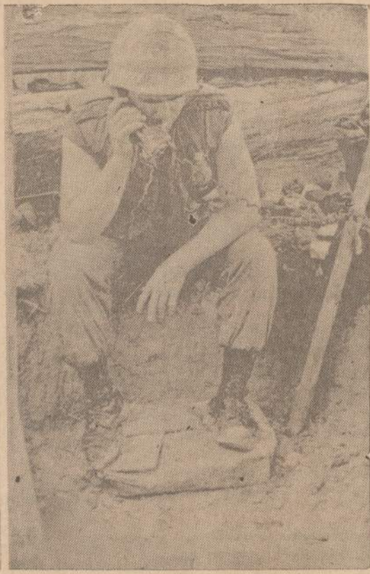
JAV pirmos divizijos karys iš fronto linijos telefonu praneša savo viršininkams apie Bien Hoa srityje įvykusį komunistų šaulių užpuolimą. Priešas buvo priverstas trauktis, didesnių nuostolių nepadarė. Krašto apsaugos sekretorius MacNamara buvo užvažiavęs į Bien Hoa bazę ir kalbėjosi su karo vadais bei eiliniais Amerikos karais.