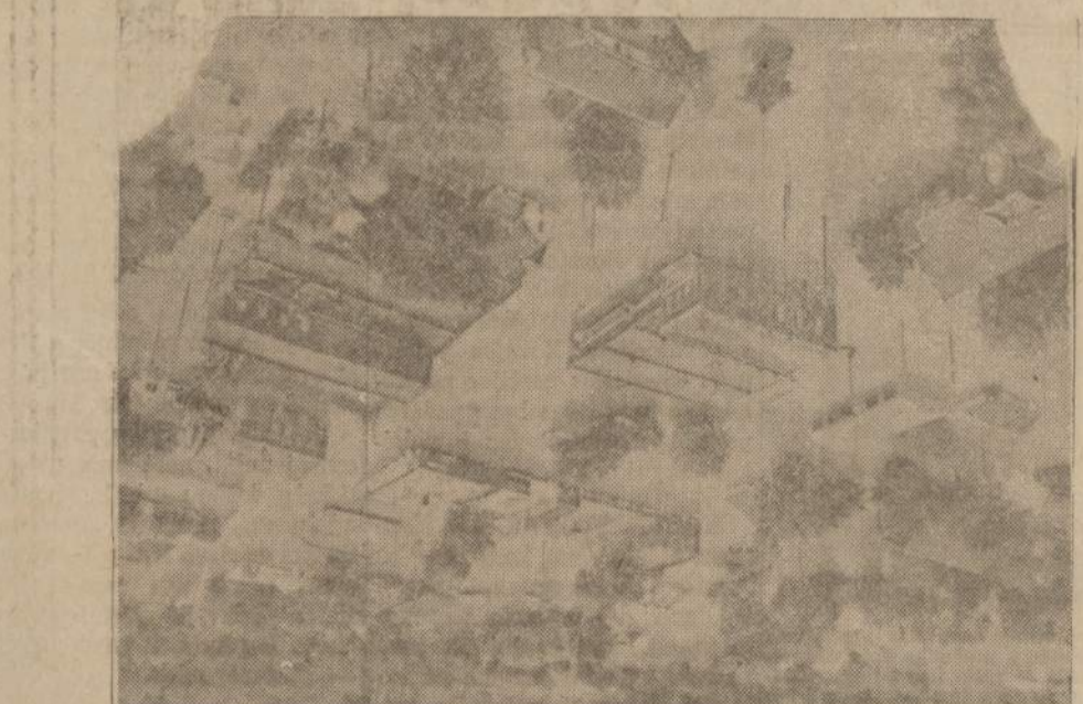
Smarkus lietus Missouri valstybėje sukėlė potvynius ir padarė daug nuostolių. Little Platte upės vandenys pakilo ir apėmė paveikslą matomą Smithville miestelį.

GERBIAMAS NAUJINI PRIETELI, PAAUKODAMAS NAUJIENU MASI NU FONUI, ATLIKSI DIDELI IR GARBINGA DARBA. KIEKVIENA DIDELE AR MAZA AUKA BUS TINKAMAI IVERTINTA.