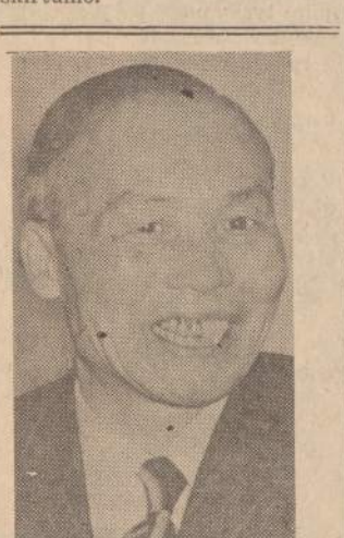
Buves Kinijos valdžios pareigūnas Li Tsung-jen, praleidęs apie dešimt metų JAV ir susipykęs su gen. Čankaišeku, su savo žmona nuvyko į Pekiną ir pradėjo pūras drausyti Ameriką. Pas komunistus perbėgusi kinietė Pekino stotyje pasitiko pats Kinijos premjeras.

Šitai žinodamas, prezidentas Kennedy nesustabdė planuotos invazijos, nors jai tuo metu padėtis nebuvo visai palanki.