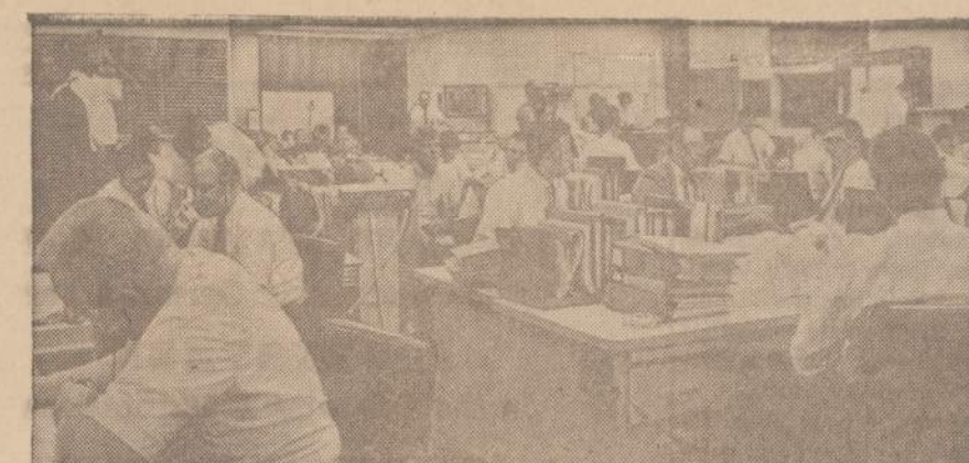
Kalifornijoje, Pasadena miestelyje, mokslininkai skaičiuoja Mariner IV atsiųstas žinias apie Marso paviršių. Trečiadienį Mariner IV praskrido pro Marsą. Be fotografijų, jis siunčia įvairias kitokias informacijas apie šią planetą.

Mariner 4 po pusaštunto mėnesio skridimo pasivijo Marsą ir per 25 minutes praskridamas 4,000 mylių platumo Marso skersmenį, iš artimiausiai 6,118 mylių padarė eilę nuotraukų, kurių jau didesnę pusę parsiauntė laboratorijoms ištyrti. Visa, kas tose dykumose kol kas aiškiau matyti, tai kažkokia ir raiđe panašus formacija ir i kraterį panašus įdubimas apie 12 mylių skersmens. Mariner įstengė padaryti nuotraukas iki 2 mylių didumo objektų ir tai esą 30 kartų geriau, negu fotografuojant nuo žemės per geriausius teleskopus.