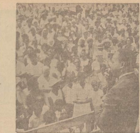
Dr. Martin Luther King atvyko į Chicago kalbą skaityti. Chicago miestas tuoj davė jam policijos apsaugą, kad nekiltų kokio nesuspriktimo. Praeitę sekmadienį Dr. King sakė kalbas Chicago juodžiams, kviesdamas juos pirmadienį susirinkti prie miesto savivaldybės. Jis mano, kad demonstracijomis pagerins teisingą juodžių būklę ir prievarta prims baltiesiems integraciją.

Senato komitetas jau turi paruošęs kelis pasiūlymus automobilstų apsaugai. Pirmiausia bus reikalaujama, kad visi naujieji automobiliai turėtų saugumo diržus. Bus taip pat nustatyta, kokios turi būti gaminamos padangos (dabar gaminama 26 rūšių padangos). Iš viso numatyta automobilstams 16 visokių pridėklų, kurie menamai prisidės prie saugesnio važinėjimo automobiliais.