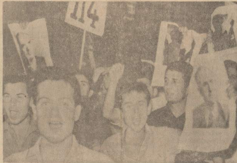
Atėnuose atleisto premjero Papanreū šalininkai protestuoja prieš karalių ir naują vyriausybę. Jaunuoliai reikalauja, kad Papanreū vėl būtų sugrąžintas valdžios priešakin.

je laikraščius parduodė Latvijos vokietė, gerai kalbanti volgiškai ir rusiškai. Tik ne lietuviškai.