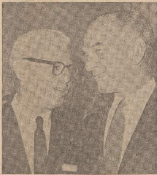
Ambasadorius Arthur Goldberg kalbasi su senato užsienio komiteto pirmininku J. William Fulbright. Komitetas Goldberg patvirtino JAV ambasadorium prie Jungtinių Tautų. Buvo pasklaidę gandai, kad prezidentas ambasadorium rengiasi paskirti senatorių Fulbright.