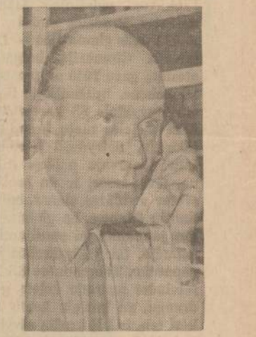
Prezidentas Johnsonas pasikyrė valstybės gynyba Nicholas Katzenbach vadovauti 18 žmonių komisijai, kuri turės išaiškinti vis dažnėjančių nusikaltimų priežastis ir rasti būdus tiems nusikaltimams sumažinti. Prezidentas yra pasiryžęs sustabdyti nusikaltimų, užpildinėjimų ir vagysčių bangą.