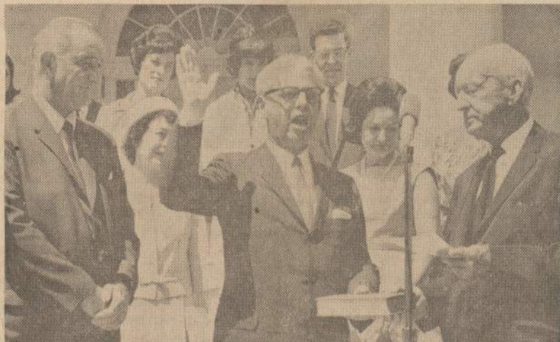
Arthur J. Goldbergas prisiskindamas JAV ambasadoriaus prie Jungtinių Tautų pareigoms. Priskindino vyriausio teismo teisėjas Hugo Black. Prezidentas, ambasadoriaus šeimos nariai ir kiti pareigūnai stebėjo prisiskindimą ir klausėsi ambasadoriaus kalbos.

◆ Vakar vakare pradėjo siausti audros šiaurinėje Michigan ežero srityje. Audra ėjo į pietus.