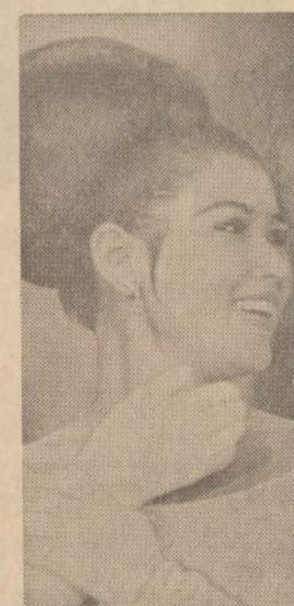
Apasra Hongsakula, tajietė, laimėjusi Pasaulio Grežio Karalienės titulą, pradeda savo karaliavimo džiaugsmingą šypseną. Ji norinti būti žurnaliste. Pradžioje ji rūpinosi, kaip galėsianti gauti vietos savo šilkiui. Dabar kiekvieno didesnio dienraščio puslapis jai bus atidaryti. Ji pasižadėjusi rašyti apie suvažiavusias pasaulio gražuoles.

◆ Tito prarastos ekonominės reformos smarkiai palietė kiekvieną krašto gyventoją. Sumažinta dinaro perkamoji galia. Už dolerį teks mokėti 1,250 dinarų. Labiausiai nukentėjusi pinigų bankuose laikiusieji žmonės. Prekes turėjusieji laimėjo, nes jų kaina žymiai pakilo.