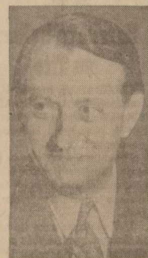
Prancūzijos kultūros reikalų ministras Andre Malraux važinėja į Tolimuosius Rytus. Jam pavyko išsikalbėti su keliais komunistų vadovais. Dabar patys prancūzai skelbia, kad sugrįžęs Malraux galės tarpinkauti tarp laivojo pasaulio ir Vietnamo komunistų. Gen. Charles de Gaulle nori būti arbitru tarp komunistinio ir laivojo pasaulio.