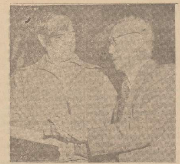
Buvęs Korėjos prezidentas Syman Rhee kalbasi su gen. Douglas MacArthur 1950 metais. Gen. MacArthur mirė prieš porą metų, o prezidentas Rhee mirė praėjus sekmadienį Havajų senelių prieglaudoje.

Kokią reikšmę turi tie visi patentai (atseit, nauji išradimai)? Tų naujų išradimų ir jų pritaikymo dėka Amerika pirmąją pramonės srityje. Jos ekonominis pajėgumas yra toks, kad joks kitas kraštas su ja negali susilyginti. Jos gamyba 1964 m. buvo maždaug tokia, kaip svarbiausių vakarų Europos kraštų, pridėjus prie jų ir Sov. Sąjungą.