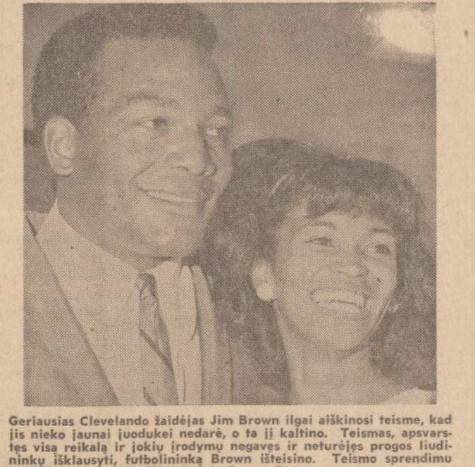
Geriausias Clevelando žaidėjas Jim Brown ilgai aiškinosi teisme, kad jis nieko jauni juodukei nedarė, o ta jį kaltino. Teismas, apsvares visą reikalą ir jokių įrodymų negavęs ir neturėjęs progos liudininkų išklausti, futbolininką Brown išteisino. Teismo sprendimu džiaugiasi ir Brown žmona.