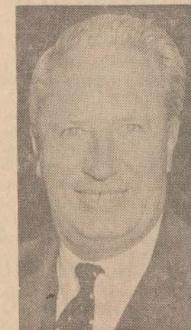
Edward Heath — naujai išrinktas britų konservatorių partijos vadas. Jis užėmė pasitraukusio Alec Home vietą.

Prezidentas atsakė, kad jis neturi informacijų, kas tas bazes statė ir kokios valstybės specialistai jas aptarnauja. Jis nabrėžė, kad JAV negali leisti, kad iš jų bazių būtų apšaudomi Amerikos lakinai. Jis nemano, kad santykiai su Sovietų Sąjunga dėl to turėtų pablogėti, nes rusai buvo informuoti apie taikius JAV tikslus Vietname.