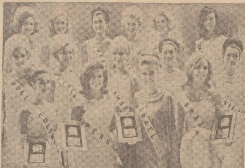
Paveiksle matome 15 gražiausių pasaulio moterų. Iš 60 suvaizavusių gražuolių, atrinko gražiausią gražiausias. Šeštadienį iš šių 15 gražiausių buvo renkama Pasaulio Grožio Karalienė.

Lietuva, Lietuvos liaudis — jokio sprendžiamo vaidmens čia nevaizduoja. Ji stebėjo įvykius, negalėdama pajudėti, paralyžuota svetimos karinės bei politinės jėgos ir jos sąmoningų ir nesąmoningų, kartais naiivių, agentų jai uždėtų pančių. Tačiau viskas buvo svertimųjų rusų daroma jos vardu: jos vardu kalbėjo ir veikė Liaudies Vyriausybė, jos vardu bu-