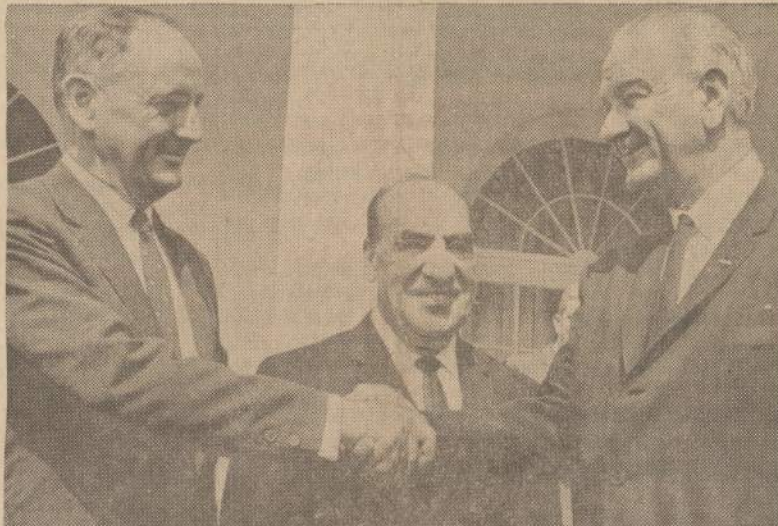
Prezidentas Johnsonas sveikina naujai paskirtą sveikatos ir švietimo sekretorių John W. Gardner. Viduryje stovi Celebreze, kurį prezidentas paskyrė į apeliacijos teismą.

Socialinio draudimo sekretorius Anthony J. Celebreze paskirtas federalinio apeliacijos teismo teisėju, o jo vieton prezidentas Johnsonas pasirinko republikoną John W. Gardner, kuris esąs nepaprastai geras administratorius.