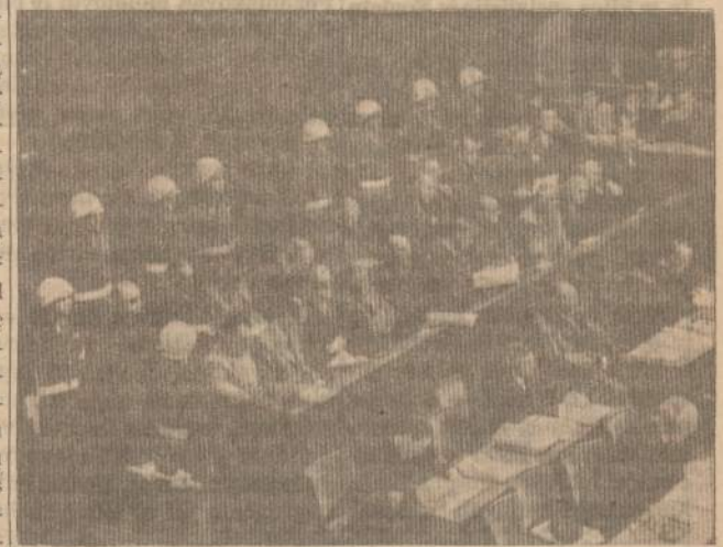
Vokiečių karų vadai tarptautiniame Nuerenbergo teisme 1946 metais. Antrąjį Pasaulio karą pradėjo, visoms Europos tautoms daug nuostolių padarė ir Vokietijai sunaikinę karą vadai buvo nuteisti ir nubauti.