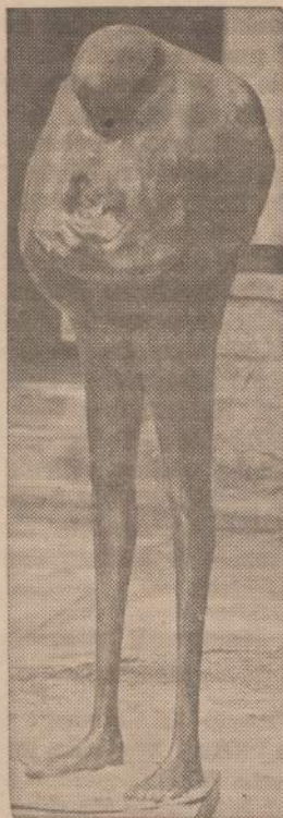
Šis aliuminijaus darbas atsirado Atlantos mieste. Kai menininkas buvo paklaustas, ką jo stovyla vaizduojanti, tai atsakęs, jog tai yra kiekvieno vaizduotės vaisius.

Neprikl. Lietuvos vyriausybės jis su pagrindu prikaišiojo trumparegystę politikoj, neapdirū ir lėta krašto ūkio reikalų tvarkymą, nesurūpinimą kultūrinių vertybių apsauga ir planingos emigracijos sloką. Skatino neatsilikti nuo didesnės pažangos pasiekusiųjų darbo spartos ir plačiųjų kultūrinės kūrybos užmojų, nesisa-