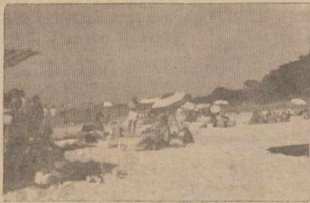
Union Piere net akys raibsta nuo "bikini" drabužėlių...

— Jeigu jau ieškoti šitų malonybių, tai reikia sukti, sakykime, į tokį Las Vegas. Ta prasme ten tikrai galima "pailsėti..." Čia mes kartais šauniai pasilinksminame tik Community Hall. Ten ant sienos kabo didis pranašas Možė. Ir ko daugiau bereikia... Tą vietelę yra pamėgę bendruomeninkai ir tau-