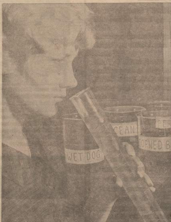
Iki šio meto geros mėsos kvapą sukeldavo gerai pagamintas geros mėsos gabalas, o dabar jau ruošiami cheminiai, kurie pagamina geriausios mėsos skonį. Paveiksle matome vieną tokios mėsos gamintoją, uostinėjančią gerai paruoštos jautienos kvapą. Netolimoje ateityje nežinosime, ar valgome gerą mėsą, ar faktai cheminiais apipiltą bet kokios mėsos gabalą.