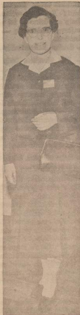
Šventos Dvasios Sesutėms tiek patiko uniformų kaitaliojimas, kad jos dabar reikalauja senus drabužius keisti kas penki metai. Paveiksle matome vienuolę naujausioje uniformoje. Jos jau visai nesirengia dėvėti baltų tokių, be kurių negalėdavo iš miegomojo išeiti.

Atsakingo kultūrininko uždavinys nėra saugoti, kad, gink Dieve, nebūtų taip, kaip yra buvę seniau, bet kad nebūtų blogiau, o ypač kad nesikartotų blogis. Jo, kultūrininko, vaidmuo neturėtų ribotis vien naujovių propaganda. Jam geriau pritiktų vėtytojo pareigos, padėdant visuomenei atskirti grūdus nuo pelų. Jei K. B.-ui labiau patikimi bažnytiniai autoriai, primenu, kad ir visuotiniame Bažnyčios galvų suvažiavime