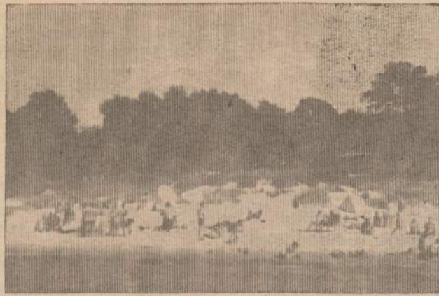
Nuogaliai, sugulę karštame paežerės smėlyje, išsprendžia visas pasaulines problemas ir baigia visus karus...

Kaip tik akimis užmatai, visas paplūdimys juoda nuogaliais. Apie ką čia šneka, kokiais rūpesčiais gyvena stuburiniai, pilvuočiai bei plaukuočiai, palikę bosus ir visokias kitokias būdas užuomarštyje didžiuose, karštuose miestuose?