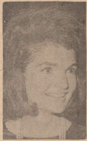
Ponia Jacqueline Kennedy minėjo savo 36 metų sukaktį Hyannis Porte, Mass., kartu su Kennedy šeimos nariais.