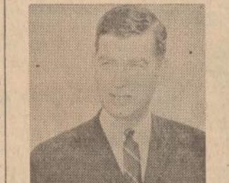
Oregono gubernatoriaus priedaria prezidento Johnsono Vietnamo politikai, bet kai kurie šios politikos aspektai jam nepatinka. Visi kiti gubernatoriai remia Johnsono politiką.

Daugelis laikraščių spėjo, kad prezidentas kalbėjo apie respublikonų vadą atstovų rūmuose Gerald Ford (Mich.).