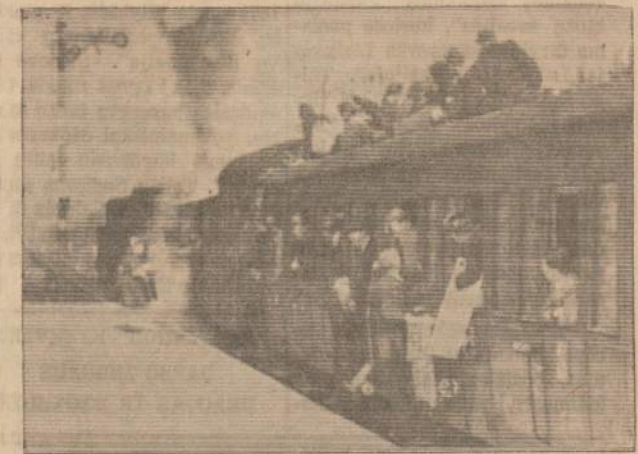
Taip pokario laikais žmonės važinėjo traukiniais Vokietijoje.