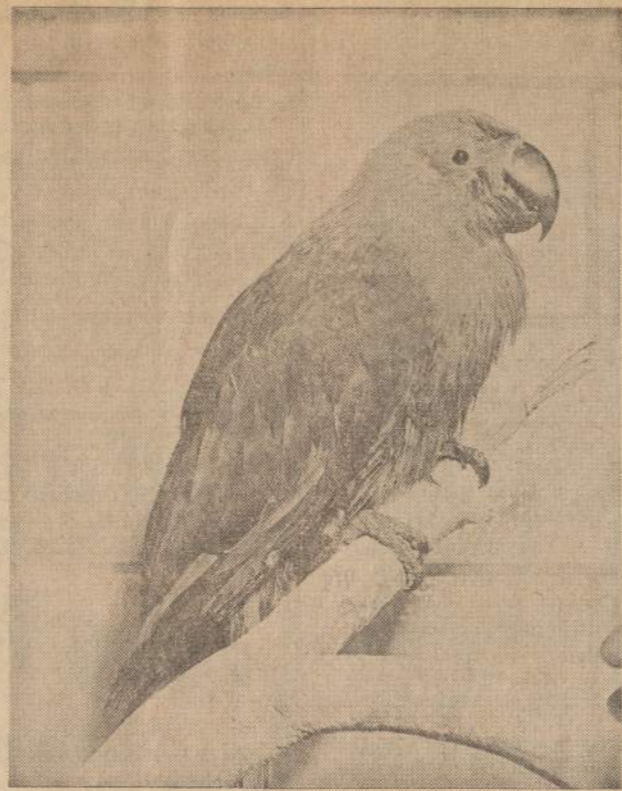
PAPŪGA — RUGPIŪCIO MĖNESIO GRAŽULĖ

Nespėjo jis atšaukti pikniką, sušilo oras ir privažiavo gana daug žmonių. Vieni girksnojo prieš baro, o antrieji maitinosi ir komentavo, ar gerai buvo