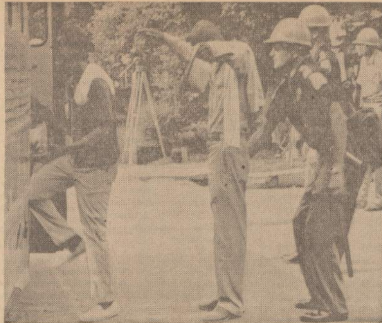
Greenboro, Ala., policija suėmė daug demonstrantų. Policija suėmė tokį didelį juodžių skaičių, kad nebuvo kam toliau demonstruoti. Eisenų organizatoriai išsiuntinėjo kvietimus į kitus miestelius, kad vyktų į Greensboro ir demonstruoti.

"NAUJLENOŠ" KLEKVIENO DARBO ŽMOGAUS DRAUGAS IR BIČIULIS