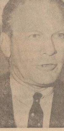
Prezidentas Johnsonas spaudos atstovams pareiškė, kad vienas respublikonų partijos vadas spaudai paskelbė konfidencialiai patikėtas Vietnamo karo informacijas. Respublikonų vadas Gerald R. Ford pareiškė, kad jis niekam nieko nesakęs ir valstybinį paslapčių kitiems neįspasakojęs. Jis turėjo padaryti šį pareiškimą, nes daugelis įtarė atstovą Fordą berieikalingai prasitarus.