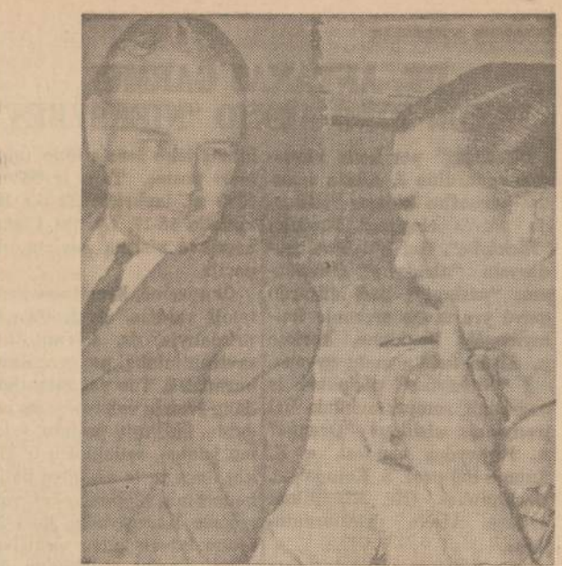
Vietnamo premjeras Ky atsiveikina su ambasadorium Maxwell Taylor, išvykstančiu į Washingtoną. Šia proga premjeras Ky pareiškė, kad Vietnamo kariuomenė nori išlaisvinti nuo komunistų piety ir šiaurės Vietnamą.