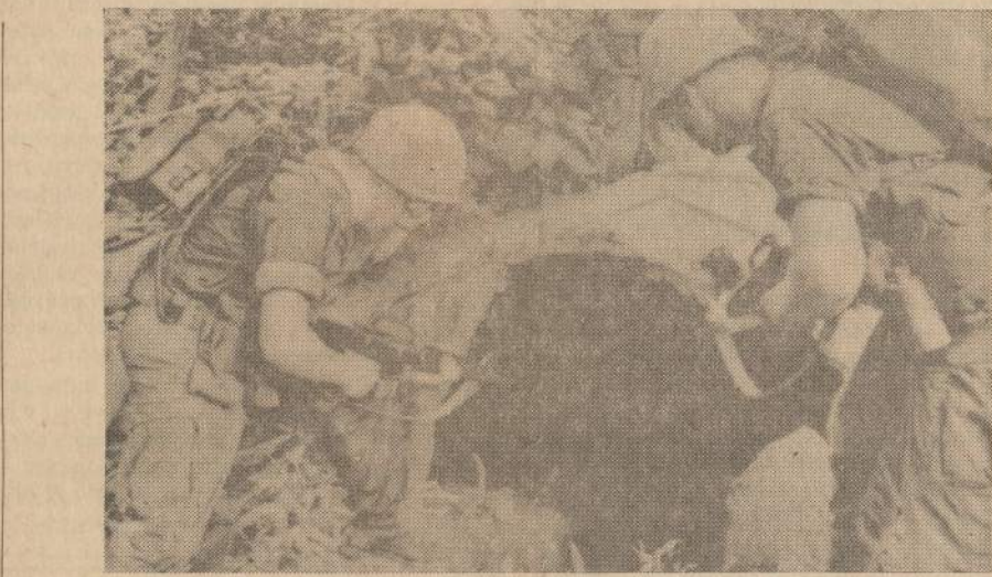
Amerikos kariai, bevaldydami pietines Saigono apylinkes, rado urvą, į kurį galėjo sulsti komunistai. Pradžioje į urvą jie pateikė kelias kulkas, o vėliau vienas blindo ir padėjo didesnį kiekį dinamito, kurio sprogdimas galėjo užmušti komunistus.

LONDONAS. — Britų darbių vyriausybė nutarė sumažinti spalvotųjų imigrantų skaičių. Vietoje 20,000 per metus ateityje bus įsileidžiama tik 8,500 imigrantai. Bus griežčiau reikalaujama darbo pažymėjimų ir kitų garantijų. Iki šiol į Britaniją po karo atvažiuavo virš milijono spalvotųjų žmonių iš Jaimaikos, Indijos ir Pakistano.