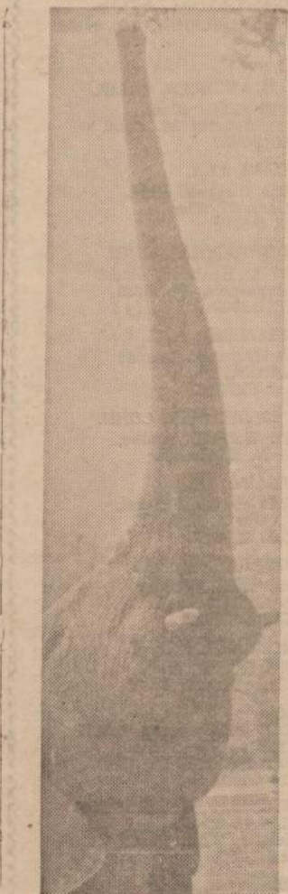
Dramblys, neturėdamas ką veikti, kečia savo snapą ir siekia greta esančio medžio lapų.

Gi Krašto Valdybos paskelbta, kad 1964 m. viso aukų surinkta