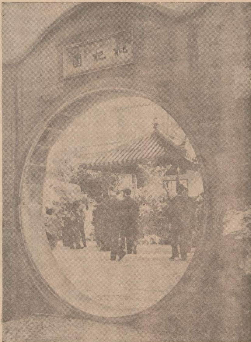
Didžiojoje Kinijos sienoje yra skylė, pro kurią galima matyti Loquat Sodo vaizdą. Tarp Kinijos ir Rusijos esanti siena kasdien vis labiau saugojama iš abiejų pusių.