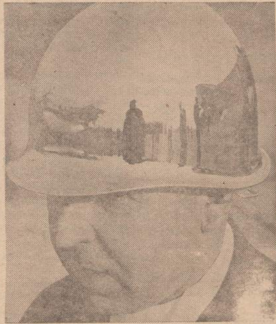
Amerikos kariai turi būti švarūs ir išsiblizgine. Šio kario kepurė taip blizga, kad joje atsispindi visa karių rikiuote. Fotografija imta Anglijoje esančioje aviacijos bazėje.