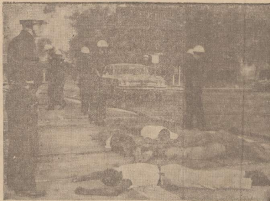
Los Angeles policija apriamo Watts distriktą. Sekmadienio rytą juodžiai dar bandė šaudyti į policiją, bet kai nacionalinės gvardijos kariai nušovė kelis šaulius, paleidusius į policiją šovius, tai visas Watts distriktas aprimo.

GYDYTOJAS IR CHIRURGAS 756 WEST 35 STREET