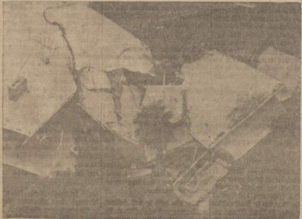
Taip atrodo prabangus losangolietiško namas Pacific Palisades rajone, kai griūdamas kalnas namą suardė.