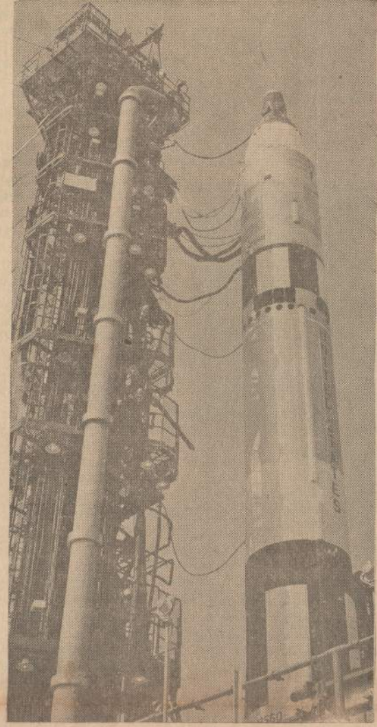
Paveiksle matoma Titano raketa, turinti 430,000 svaru stumiamos jėgos, ketvirtadienio rytą išmės į orbitą Amerikos astronautus Gordon Cooper ir Charles Conrad.