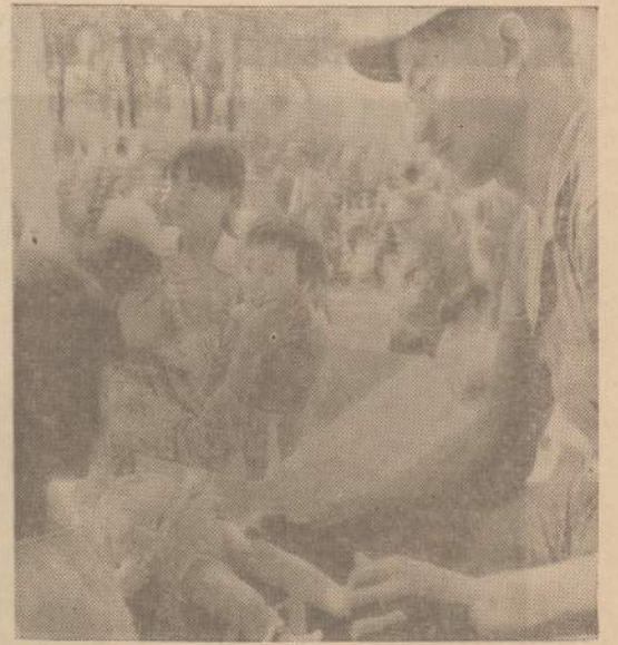
Da Nang srityje yra našlaičių namai. Duota prieglauda karo metu žuvusių tėvų vaikams. JAV mariniai felkiai našlaičiams maistą ir lėles.

— Kai sveikinausi, tai ant jų rankų kraujo nemačiau, —