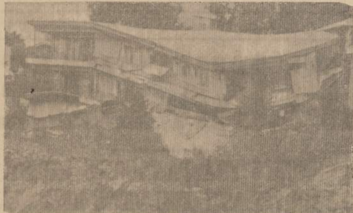
Los Angeles Pacific Palisades kalnai slenkant, griūva aštuonių apartamentų namas