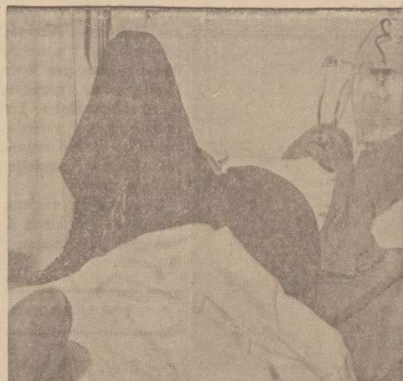
Juokdarys Dick Gregory buvo nuskrūdes į Los Angeles. Jis bandė ištikinti maištaujančius jaunuolius aprimti, bet jį buvo paleista mažo revolverio kulka, kuri sužaidė koją. Matome juokdarį Los Angeles ligoninėje, laukiantį pagalbos.

Vakarų spauda, nors ir nepasiskūsi neigiamai apie "Mergaitę ir aidą", vis dėlto vilniškio filmo nevertino, kaip žymesnio indėlio, kurį būtina premijuoti tarptautiniuose festivaliuose. (E)