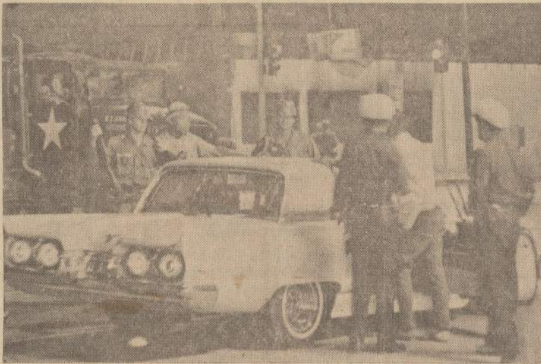
Los Angeles policija tikrina pravažiuojančius automobilius. Bijoma, kad musulmai vėl nepradėtų vežti ginklus į Watt distriktą.

Izdo sekretorius pareiškė vilgti, kad tose pramonės šakose, kur biznierių tik dalis pakėlė kainas, perkantioji publika privers juos kainas sumažinti, pirkdama pas tuos, kurie akcizo mokesčius numėmė, kainų nepakėlė. Iš golfo įrankių gamintojų 30% akcizo mokesčius panaikino, o 70% sau pasidėmė numušti kainas dalį.