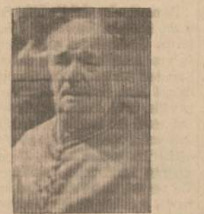
Kardinolas Ottaviani, Sventojo Ofiso viršininkas, vyriausias Kurijos ir re-akcijos vadas.

Popiežius Jonas darė visa ką galėdamas, kad galėtų rasti bendrą kalbą su Kurija. Vietoje nukirtos keletų persenujų galvų, jis bandė tas galvas palenkti švelnumu ir mandagumu. Kardinolas Tardini, kurs iš pat pradžios pradėjo žengti vieną žingsnį pirmyn ir du atgal, pasistengė palaikyti visą prasidėjusį san-