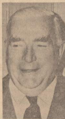
Australijos premjeras Robert Menzies pasitvėrė į Vietnamą 350 karių kovai prieš besiveržiančius šiaurės komunistus. Australija piiniausiai remia JAV politiką Vietname.

KAIRAS. — Egipto prezidentas Nasseris tariasi su Jemeno vadais. Netrukus jis susitiks su Saudi Arabijos karaliumi tartis dėl taikos civiliniame Jemeno kare, kur vieną pusę remia Egiptas, o kitą — Saudi Arabija.