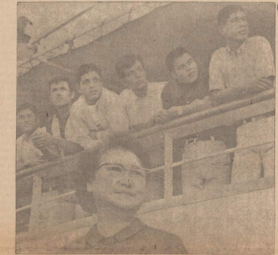
Japonė Miki Sawada Los Angeles uoste pakeliui į Braziliją su jos užaugintais karo pamestinukais. Ji Brazilijoje įkurdins 1,280 berniukų ir mergaičių, kuriems, kaip karo vaikams, Japonijoje atėities nėra.

Teismas kiekvienam gali paskirti po penkerius metus kalėjimo ir po $5,000 baudą.