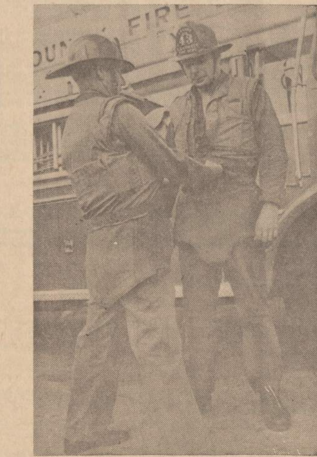
Los Angeles gaisrininkai turi dėvėti neopraunamus šarvus, nes juodžiai apsaudo gaisrininkus, kai jie nuvažiuoja gesinti padegų namų.

NEWARKAS. — Teisėjas išsprendė dviejų besiginčijančių dėl šunies bylą, leisdamas pačiam šuniui nuspręsti. Du Newarko gyventojai savinosi vieną šunį. Vienas sakė, kad tai jo "Princas", o kitas tvirtino, kad tai jo "Boy". Teisėjas patarė abu varžovus 10 pėdų atstume