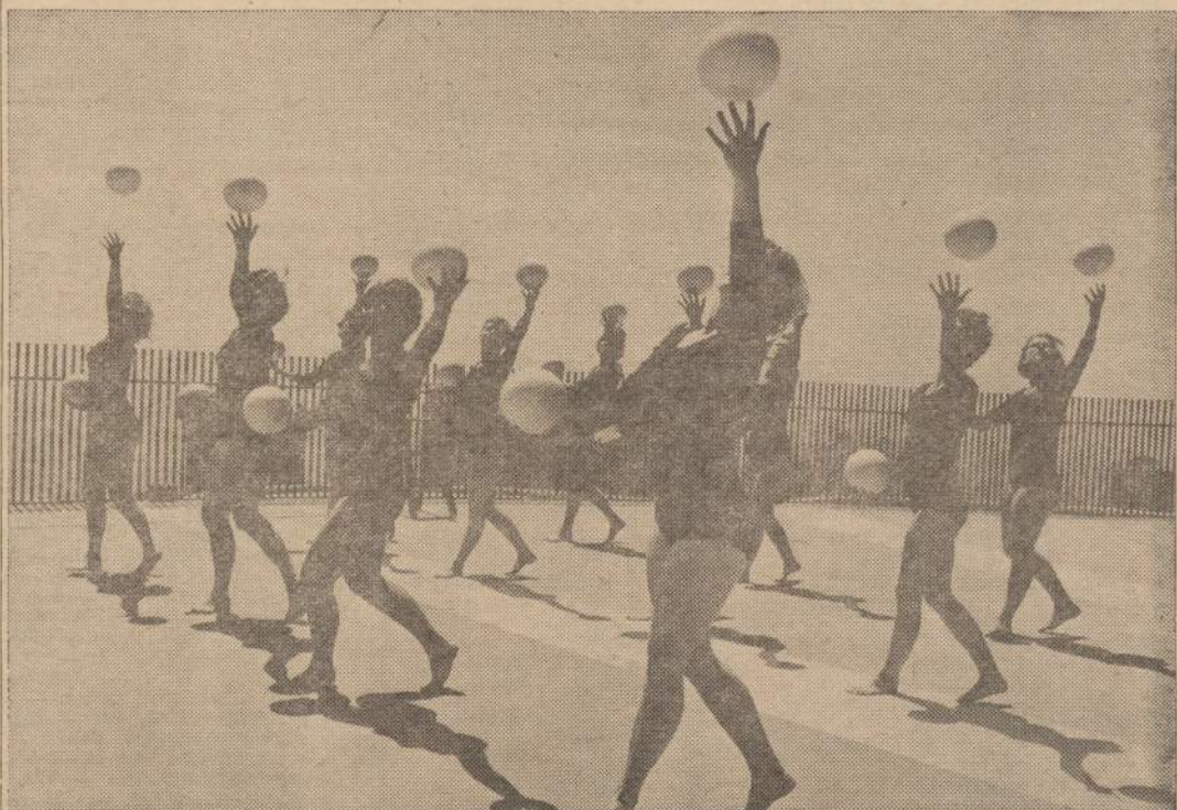
Jaunos švedės, Malmo miesto gimnastikos mokinės, važinėja po Ameriką ir rodo, kaip jaunos švedės gimnastikuojasi. Paveiksle matome Malmo mergaičių pratybas Čikagoje. Jos sutartinai mėto sviedinį.