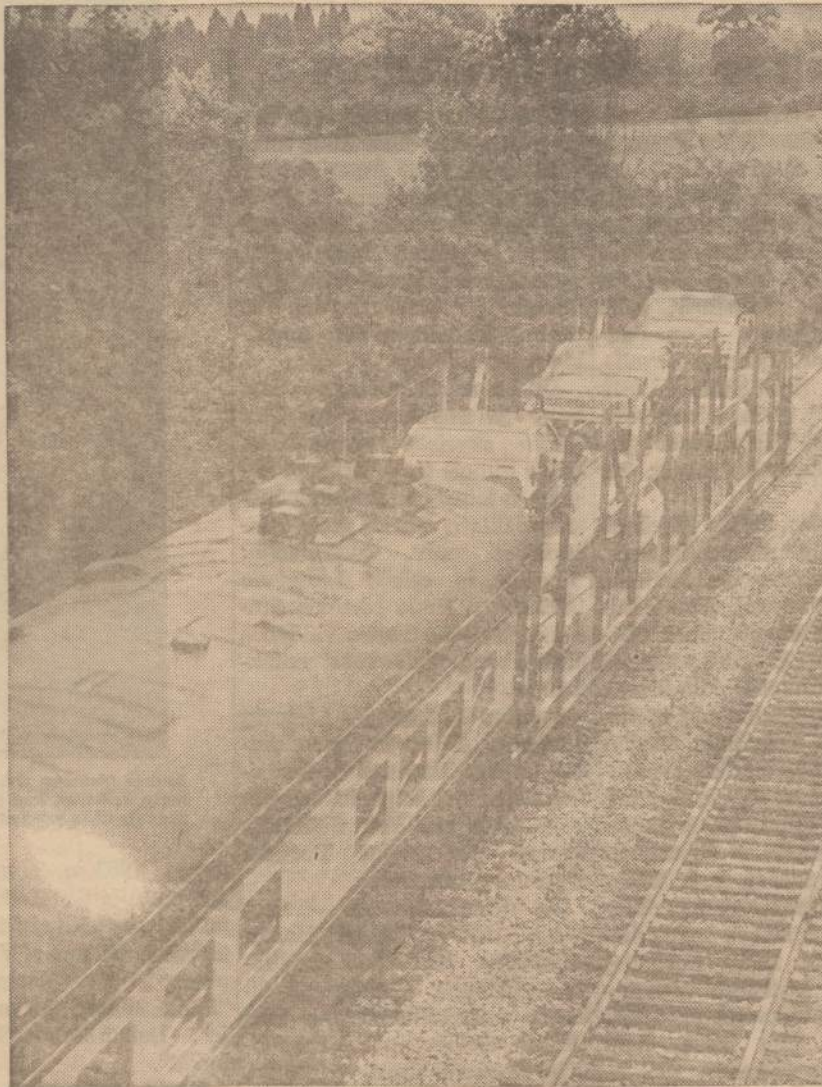
Keleiviai Amerikos traukiniais jau gali nusivežti savo automobilius. Paveiksle matome keleivinį vagoną ir prie jo prisegta platforma, kuri veža į Washingtoną keleivių automobilius. Prie keleivinių traukinių bus prisegamos panašios platformos automobiliams pervežti.

Po to prasidėjo pasitarimas, kaip tuos metus praleisti. Vieni siūlė vienaip, kiti kitaip. Ir kas nuostabu, daugiausia aktyvumo