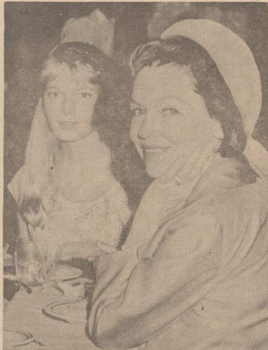
Artistė Maureen O'Sullivan ir josios duklė Mia Farrow. Paskutiniu metu kalbama, kad Mia Farrow rengiasi ištekti už Frank Sinatros, nors jis už ją yra žymiai vyresnis. Sinatra yra 49 metų, o Mia Farrow dar nesulaukė nei 20 metų.