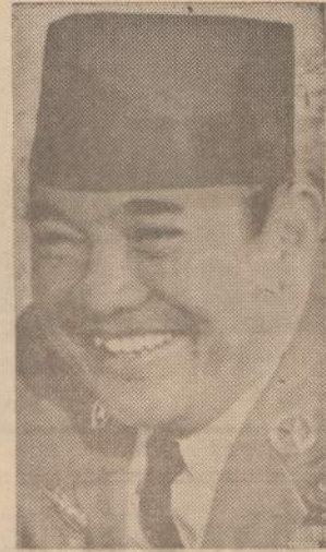
Indonezijos prezidentas Sukarno patarė JAV ir britams išsikraustyti iš pietų Azijos. Jeigu nepaklausys, tai komunistinės Kinijos ir jo valdomos Indonezijos bus išmesti iš visos pietų Azijos.

Panašiai sėkmingai baigėsi bandymai dėl šunų panaudojimo žemėn įlindusių metalinių dalių atradimų. Keturiš me-