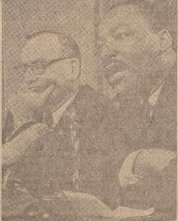
Los Angeles gubernatorius Edmund E. Brown ir juodžių vadas Dr. King padarė pareiškimus spaudai. Jiedu apilanke nukentėjusią Watt sritį. Gub. Brown prašys federalinės valdžios atstatyti išgrautą juodžių distriktą. Dr. King nori sudaryti komisiją, kuri tyrinėtų žiaurų policijos eiseį su maistaujantiems juodžiams.