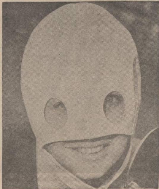
Londono moteriškų skrybėlių gamintojas paruošė šią skrybėlaitę šiam rudeniu ir žiemai. Ji apsaugos moteris nuo vėjo ir sniego.

Anglų karo kabinetas, pirminkaujant Attlee, pilnai sutiko su Ministerio Pirmininko nuomone ir telegrafavo Edenui į Maskvą, kad jis negalįs eiti toliau, kaip sutarta, pirma Lon-