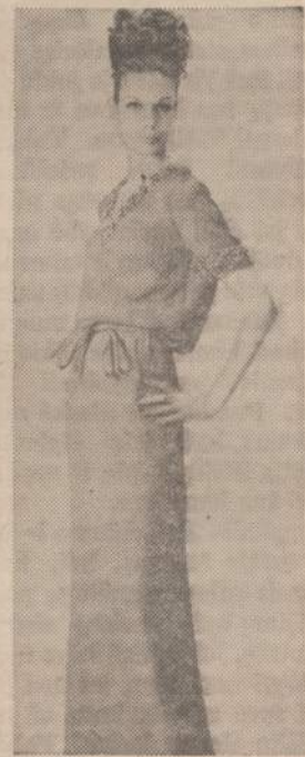
Vakarinis Amerikos moterų aprėdėlas, išdabintas įvairiais gintaro karoliais.