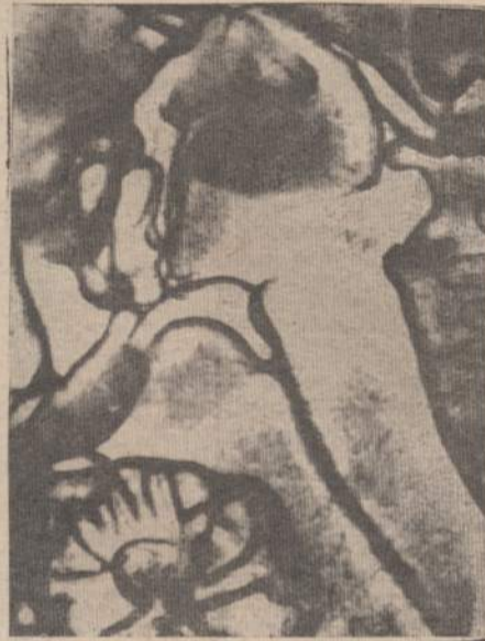
M. IVANAUSKAS — "Skulptūros fragmentas"

Iš lietuvių, be V. Biržiškos, yra jis suminėjęs dar šiuos autorius: K. Jablonskį — "1510 m. Albrechto biblioteka", — VVU mokslinės bibliotekos metraštis