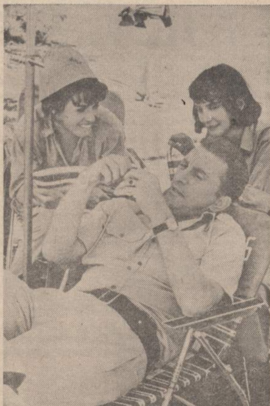
Filmų bendrovė kiekvieną dieną artistui Kirk Douglas duoda valandą poilsio, bet jam ramybės neduoda Senta Berger ir Rina Ganor.