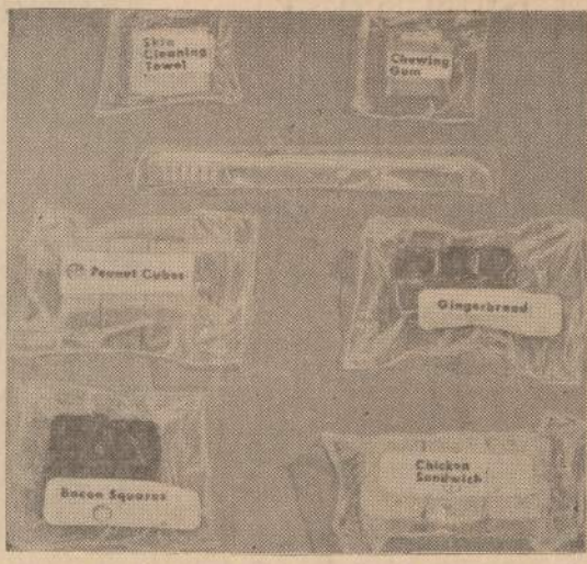
Astronautai jau 6 dienas praleido erdvėje. Bekidami į padanges, įdėję pasiemę įvairaus maisto, tikrai pasakoja, kad nesinori valgyti. Kiekvienas patiekalas buvo gražiai sudėtas į plastikinius maišelius. Jiems duotas ir dantų šepetukas, kad galėtų dantis nusivalyti. Astronautai pasakoja, kad jie negali tinkamai išimiegoti, nes įdėję apkruti įvairiais darbais.

Pačiame Brookso miestelyje nieko išskirtino nėra. Kaip ir visose transkanadinio geležinkelio stotyse, ir čia aukštai iškilęs grūdų elevatorius. Poroje judriausių gatvių yra išsiriškęs eilė krautuvių, kuriose prieinamomis kainomis galima gauti