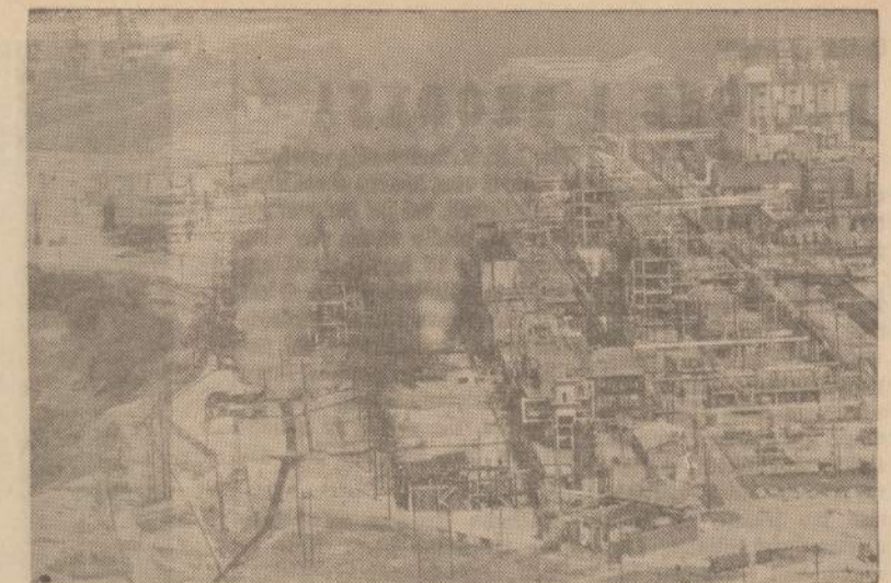
Louisville, Ky., miestelio DuPont chemijos dirbtuvėse įvyko didelis sprogdimas, užmušęs 6 žmones. Didokas sužeistų skaičius dar tebeguli ligoninėje. Policija įsakė netoliese gyvenantiems žmonėms išsikraustyti kad nepasikartotų nauji sprogdimai.