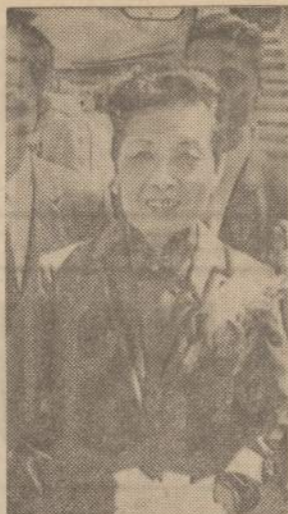
Chiang Kaišeko žmona vėl atskrido į JAV. Ji tikisi pasimatyti su senais pažįstamais ir pasikalbėti, jei galės, su politikais.