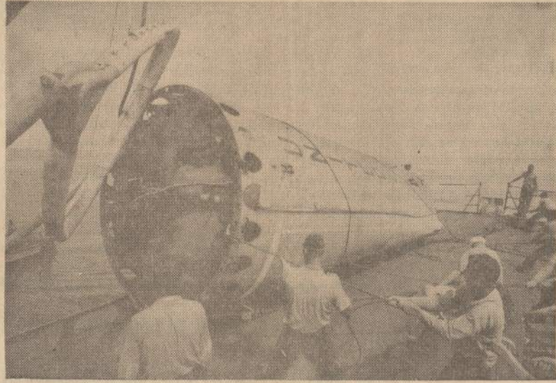
Erdvėlaivį į orbitą iškelės šovinyvis nukrito į Atlanta. Karo laivas "Drumont", radęs šovinį 640 mylių atstume nuo Bermudų salų, ištraukė jį iš vandens ir vežė į uostą, kad specialistai galėtų jį apžiūrėti.

MEKSIKA. — Kuba atsiskyrė prisidėti prie Pietų Amerikos kraštų sutarties, kuri draudžia Pietų Amerikoje turėti ar vartoti atominius ginklus. Kubos vyriausybė pareiškė pritaranti tai sutarčiai, tačiau negalinti pasirašyti, kol "vienintelė atominė galybė šiam pusrutulyje laiko karines bazes Kuboje ir veda prieš Kubą agresyvią politiką".