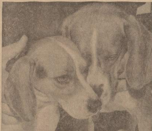
Du Baltųjų Rūmų ūnys, kuriuos pats prezidentas dažnai išveda pasivaikščioti. Jie vadinasi Him and Her. Manoma, kad ji jau laukia mažuku.

Reikalavimas, kad Amerikos laivai vežtų bent pusę sovietams parduotų kviečių kilo 1963 metais. Amerikos darbininkų unitas pasijė buvo su skaudžiais nuostoliais sulaukyti ir apsupti.