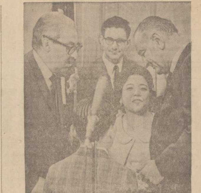
Thurgood Marshall, vyriausias teisingumo departamento advokatas, supažindina prezidentą Johnsoną su savo šeimos nariais. Tai pirmas juodis, paskirtas tokioms aukščioms teisingumo departamento pareigoms.

Apie San Francisco miestą ir jo lietuviškąją koloniją — kiek vėliau visai atskirai.