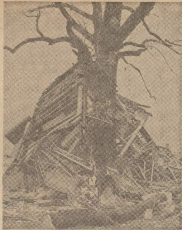
Audra ir stiprus vėjas pakėlė naują namą ir trenkė į gerokai aplaužytą žuvalą. Už kiek laiko toje pačioje vietoje pasisuko juodas vamzdis, nosį nuleidęs iš debesų, ir net pamatus to namo ivertė. Taip buvo aplaužytas namas ir išgrauti pamatai Lockport, Ill., miestelyje.

akarinė žvaigždė (kitais atvejais Aušrinė), 1. Venus-Venera, po pusvalandžio saulei nusileidus matoma pietų - vakarų danguje; 2. Marsas, 30 min. po saulėlydžio 16 laipsnių aukštyje pietvakarių danguje, ir 3. Saturnas, dvi valandas po saulėlydžio 17 laipsnių aukštumoje pietų-rytų danguje.