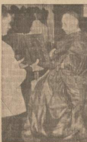
Kardinolas Cicognani, Vatikano valstybės sekretorius.

Šventasis Ofisas tebesivaduoja daugeliu iš Inkvizicijos laikų užsilikusių metodų. Iš dvylikos Vatikano kongregacijų - ministerių, sudarančių kaip ir ministerių kabinetą - Kuriją, šventasis Ofisas eina teisingumo ministerijos pareigas. Ofisui priklauso šeimų bylos, "kriminalinės" bylos ir "doktrinarinės" bylos. Krimi-