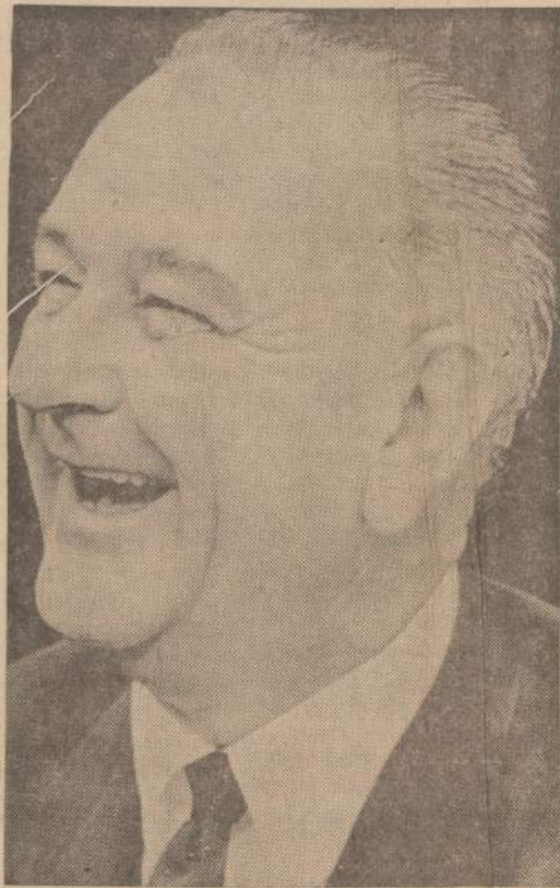
Prezidentas L. B. Johnson džiaugiasi, kai Baltųjų Rūmų turnautojai pasveikino jį 57 metų sukakties proga. Prezidentas išvažiavo į Texas, kur jam žmona suruošė didelių gimtadienio pietus ir sulaukė kaimynus. Prezidentas gimtadienį praleis savo ūkyje.

yra svarbios radaro stotys ir kelios 6-to Amerikos laivyno bazės. Prieš jas dabar Graikijos komunistai nukreipė savo propagandą.