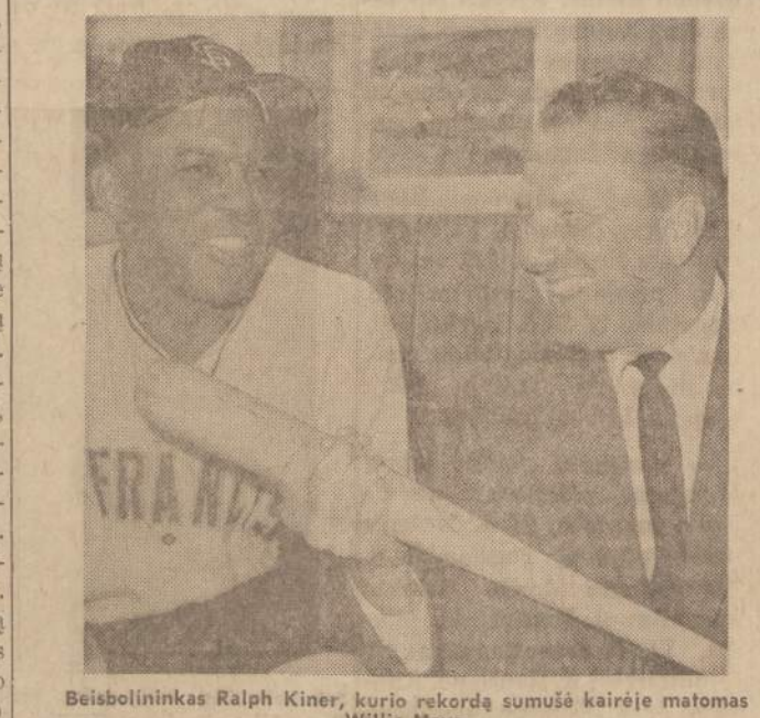
Beisbolininkas Ralph Kiner, kurio rekordą sumušė kairėje matomas Willie Mays.