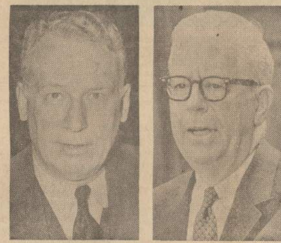
Finansų sekretorius John Fowler ir sekret. Rusk pavaduotojas George Ball išskrido į Europą...