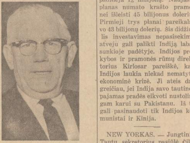
Generolas Antonio Imbert Barreras pranešė per krašto radijo ir televizijos stotį, kad jo vyriausybė yra pasiryžusi pasitraukti...

NEW YORKAS. — Jungtinių Tautų finansiniams sunkumams palengvinti Ghana pasižadėjo įmokėti 20,000 dolerių.