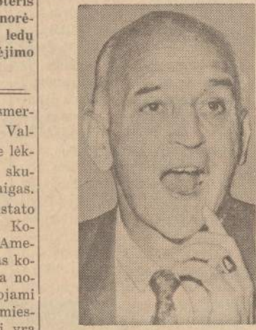
Prezidentas Johnsonas pasiuntė savo asmeniško lėktuvo ir įsakė suvažiuoti į Washingtoną plieno pramonės ir darbininkų unijų atstovus...