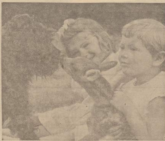
Keturų metų mergaitė supažindina trijų savaičių stirniuką su savo žuniuku. Jos draugė atidžiai seka supažindinimo ceremonijas.

Prez. Rooseveltui buvo reikalinga pagaiba prieš japonus ir jis neturėjo jokio intereso pykinti Staliną raizgiomis problemomis, kurios galėjo palaukti Taikos Konferencijos. Visų politikierių tikslas buvo pirma laimėti karą ir tam reikią nesupykinti rusų. Tai sena dilema, kur