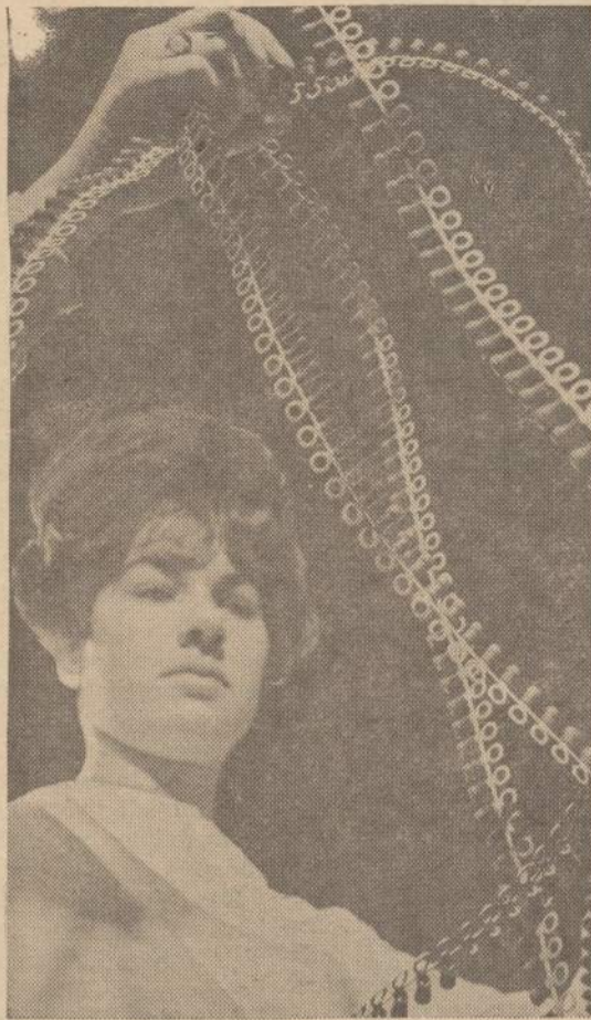
Modernios elektros pramonės inspektorė tikrina elektros sujungimus. Viskas daroma automatiškai, bet tikrinti gali tik tai budri moters akis.

1945 m. gegužės 11 d. Churchillis rašo prez. Trumanui, kad jam džiugu, žinant prez. Trumano nusistatymą laikytis tei-