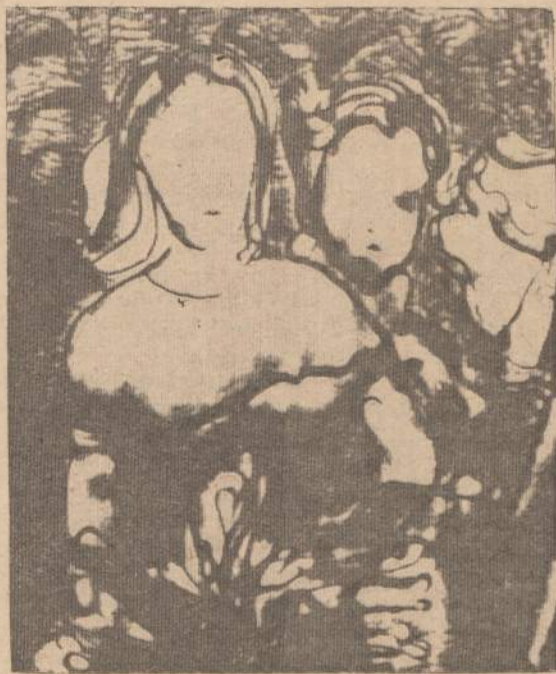
M. Ivanauskas "Meilės maršo" fragmentas (Iš parodos Roosevelt mokykloje, Ciceroje)