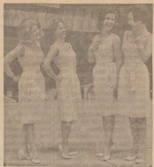
Atlantic City, N. J. gražuolių kontestant atvažiuo keturios gražuolės, apsidėžiusios tokiomis pačiomis suknelėmis. Viena iš Oklahomos, kita iš Washingtono, trečioji iš Texaso, o ketvirtoji iš Indijos. Jas matome kartu nusifotografavusias. Tvirtinama, kad jos turi gerą skonį, pasirinko tinkamas sukneles.

Nesuprantamas lietuvių dvasiškų toks greitas sveitimai dvasiai pasidavimas, bei jų lietuvių kunigui priderančios veikos atsakymas. Jų neorganizuotumas. Kai pasaulietinėse organizacijose, ar jos būtų socialinio, žaliųo internacjonalo, ar katalikiškos linkmūnstinio žmogaus nudvasinimo pavojus, tai šiandien Bažnyčios suvažiavime Vatikane šio pavojaus nėra kam išskelti ir jo tinkamai pristatyti. O juk turime ten ir savo nuosavą, laisvajai Lietuvai atstovaujantį atstovą! Popiežius ir Jungtines Tautas teskreipia tik vargšų globos reikalu, visai neužsiimdamas apė daromą brutalią skriaudą ūkiniesiems už geležinės uždangos. Dėl ko? Ar jie jau ir Vatikane yra nurašyti? Ar ne dėl tos pačios priežasties kada tai nebuvo išgirstas ir mūsų partizanų kėtuju ra-