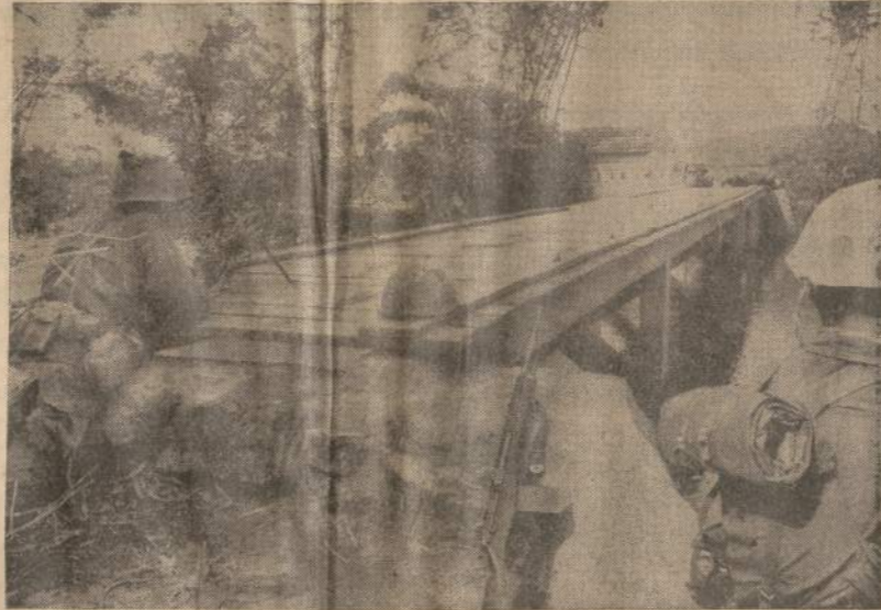
Vietname, Quí Nhon srityje, įvykė keli susišauvimai su olose ir prie tiktų besislapstančiais komunistais šauliais. Amerikos marinas, nusiėmęs šalma ir palikęs šautuvą, šliaužia prie tilto, kad patikrintų, ar ten nėra padėtos kokios minos. Kiti kario draugai atidžiai daboja apylinkę, kad pasislėpęs komunistas nepaleistų jį kulkos.

nuo šios kaltės — deicido ir kad popiežius neapviltų arabų tikinčiųjų vilčių. Alepo demonstracijų dalyviai pasiuntė telegramus visiems Vatikano II-me suvažiavime dalyvaujantiems rytų krikščionių vyskupams, kad jie sutrukdytų žydus nuo kaltės atleidžiančios deklaracijos paskelbimą.