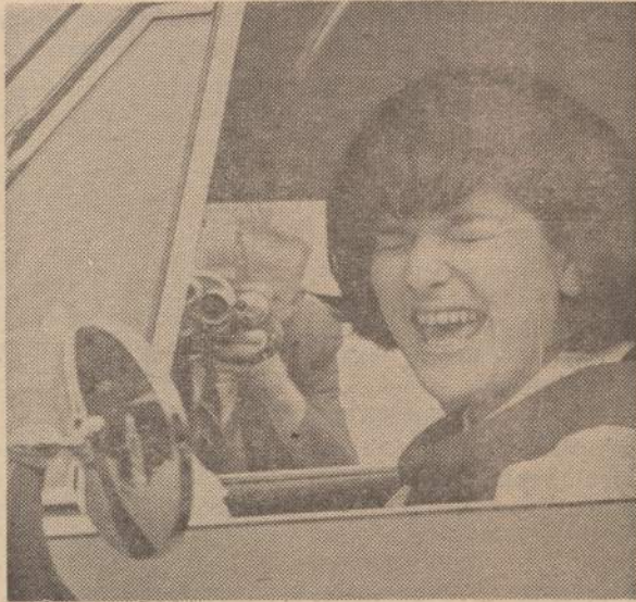
Prezidento duktė Luci Baines Johnson nori būti slaugė. Ji du metus rengiasi mokytis Georgetown universiteto slaugių mokykloje. Nauju savo automobiliu prezidento duktė važiuoja į mokyklą. Ji juokiasi, kai laikraštinkai apipylė ją įvairiausiais klausimais.

Šiuo metu Tarptautiniam Rašytojų PEN Klubui (Internat.