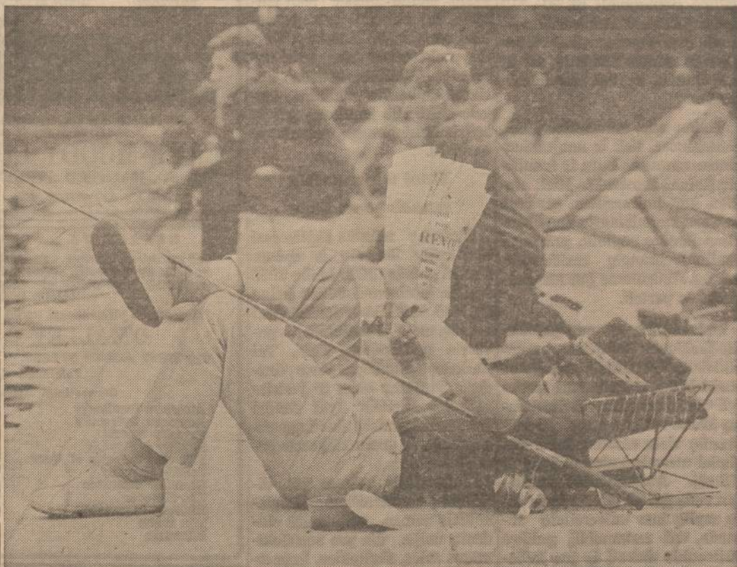
Amerikoje seniai, o Londone vaikai mėgsta meškerojoti. Paveiksle matome grupę jaunuolių, meškerojančių Temzės pakraščiuose.

Ties vaismedžių sodo kampu ir prie darželio dar smaginosi atlašios liepos — lyg kraičiais aptekusios marčios, puikybės