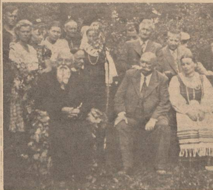
Didžiosios ir Mažosios Lietuvos Meka Bitėnuose

„Kaip ažuols druts prie Nemunėlio lietuvis nieko neatbos...“