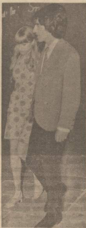
Jaunas muzikas George Harrison, be-grodamas Amerikos mažamečiams, už-sidirbo geroką pluoštą dolerių, atosto-gauja prancūzų Rivieroje, ir planuoja vesti mažametę Patricia Boyd.

Tur būt, dėl to medienos stigliaus mūsų tėvas, vos tik ūkio