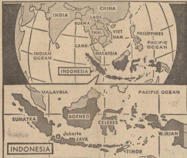
Indonezijos žemėlapis. Jakartaje keli generolai paėmė valdžią. Jie norėjo pastoti kelią Indonezijos kariams, norėjusiems nuversti Sukarno valdžią.

Sakoma, kad Panamos politikai be reikalo puola Ameriką už jos, tariamą išnaudojimą. Panamai dabartinis kanalas duoda daug pajamų. Dėl jų Panamos gyventojų uždariai ir gyvenimo lygis yra aukštesnis už daugelio kitų Pietų Amerikos kraštų. Pajamos iš kanalo sudaro beveik visą Panamos metinį būdžetą. Kiti nurodo, kad nežinūrint įvairių sunkumų Panamos ir Amerikos bendradarbiavimas tęsiasi jau 60 metų. Panamos kanalas gerai tarnavo visam pasauliui ir Amerikai. Jis padėjo Amerikai iš nestiprios, jaunos valstybės išaugti į pasaulio galią.