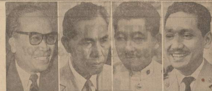
Indonezijoje revoliucine taryba sudaro šie politikai ir kariai: Pekino politika propaguoja užsienio ministeris Subandrio (kairė), premjero pavaduotojas Loemena (antras iš kairės), laivyno viršininkas adm. Martadinata ir aviacijos vicemeršalas Omar Dani (dešinė).

Catholic Digest žiniomis, Vatikano rūmuose yra 4,000 kambarių ir juose dirba 2,000 žmonių personalas.