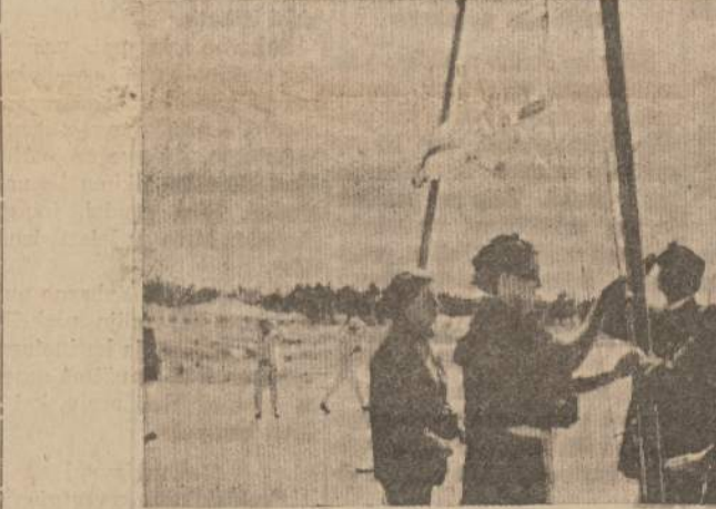
Lietuvių Jūrų Skautijos Vimpilis keliamas į krikštijamą "Neringos" tunto būrlaivį.

Savitės pabaigoje gan smarkiai audra sutrukdė vandens užsiėmimus — nulaūžė burinės valtės stiebus ir teko jį taisyti. Kar-