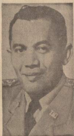
Gen. Abdul Nasution priešinis komunistų politikai. Nežinia, ar jis nesuimtas. Pranešimuose iš Indonezijos nieko apie jį neužsimenama.

Sukarno savo per radiją pasakytą kalbąje atsikreipė į armijos vadus, kad jie atvyktų pas jį ir aptartų visą padėtį. Girdė, kautynės turi pasiliauti ir nesusipratimai turi būti taikiai būdų sprendžiami. Be to, jis pridūrė, kad armija esanti jo kontrolėje ir ragino gyventojus ramiai laikytis.