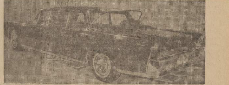
Popiežiui užsakė specialų automobilį, kuriuo papiežius Paulius VI važinės New Yorke. Užpakyti ir šonuose yra laipteliai, ant kurių galės stovėti policininkai.

GARSINKITĖS NAUJIENOSE 2 — NAUJIENOS, CHICAGO 8, ILL. — MONDAY, OCTOBER 4, 1965