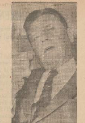
Senatorius Thruston B. Morton labai atidžiai sekė John Birch draugijos narių veikla. Jis priėjo įsitikinimo, kad ši draugija yra pasiryžusi išardyti respublikonų partiją.

Laisva, ugninga, nežabota Kūliūcy, jaunyste, nežinai! Į ateities žavingus plotus Pirmyn veržiesi amžinai