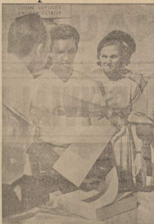
Miami, Fla., trenirinių centre kubiečiams dalinami lakštai, kuriuose jie galės surašyti Kuboje likusius gimines ir jų adresus. Castro prižadėjo juos išleisti, o JAV vyriausybė prižadėjo juos priimti. Tūkstančiai kubiečių bėga į JAV.

★ Minkė ir laužė kepė duoną. Chicagos Aušros Vartų tunto