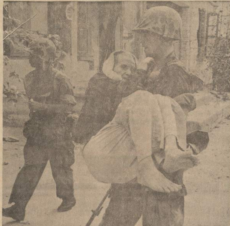
Amerikos karo vadovybė įsakė visiems gyventojams apieisti Qui Nhon miestelį, bet ne visi galėjo išvykti. Paveiksle matome JAV karį, nešančį ligonį į artimiausią pagalbos punktą.

Jeigu, tačiau, dėl Prancūzijos trukdymų ir kliūčių statymo, Amerika būtų priversta savo kariuomenę sumažinti arba visai iš Europos atsiti, tai ir visa strategija pasikeistų. Tada atominės bombos būtų pavartotos jau pačiose pirmose sovietų puolimo valandose. Šitokią politiką skatina ir de Gaulle, kuris didelę prancūzų biudžeto dalį nukreipė į stiprios atominės jėgos statybą.