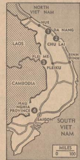
Vietnamo žemėlapis. Da Nang, Chu Lai, Plei Me ir Hau Nghia srityse tradiciniai vyko smarkūs susirėmimai su komunistais.

Dienos šviesos taupymo laikas pasibaigia sekmadienį, 2 val. ryto. Visi turime pasukti laikrodžius vieną valandą atgal.