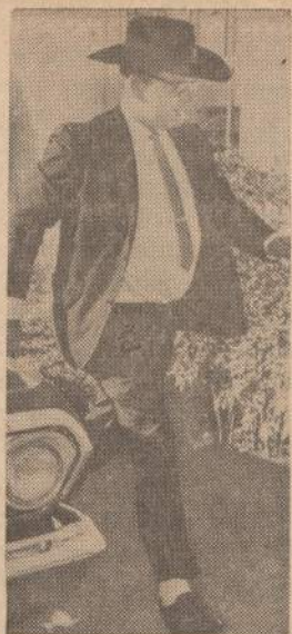
Kukluskas Leroy Wilkins buvo teisiama už Violos Luzzo nužudymą, bet Hayneville, Ala., prisiekusiųjų teismas jį išteisino. Wilkins išėina iš teismo rūmų.

Orkestras buvo sudarytas ne iš kokio pastovaus vieneto, bet surinktas iš keletos vietų. Vienok tai buvo gerai paruošti specialistai, savo dalyko žinovai. Atlikdami "Suitą iš baletu Daila", jie parodė savo išsilavinimo lygį. Galima buvo pastebėti, kaip orkestrantai buvo susikonzentravę į dirigentą ir savo partiją (veikalo), kad tiksliau galėtų atlikti autoriaus pageidavimus ir muzikos mintį. Ne veltui, kai solistai buvo apdovanoti gausiais, audringais plojimais ir ovacijomis, autorius net keletą kartų padėjo koncertmeisteriui. O kai jauna lietuvaitė prie jo krūtinės prisegė baltą gėlę, dirigentas padėjo ir, nuo krūtinės nuėmęs gėlę, prisegė ją prie koncertmeisterio krūtinės.