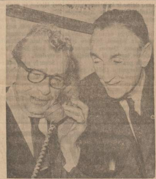
JAV kongreso daugumos vadovas Mike Mansfield ir mažumos vadovas Everett Dirksen nuyvyko į Baltuosius Rūmus pranešti prezidentui, kad šio kongreso sesija baigė savo darbą ir išsikirsto. Kongreso atstovai susirinkus faktai 1966 metų sausio 10 diena. Prezidentas pa-dėkojo kongreso vadams už sugėbėjimą pravesti didelį skaičių kraš-tui būtinų įstatymų.