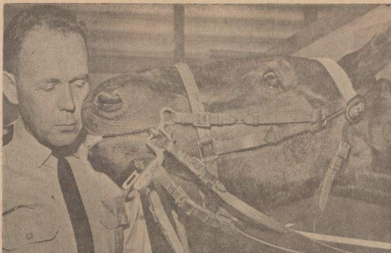
Kanados raitosios policijos dalinys dalyvaus Dallas, Tex., metinėje šventėje. Paveiksle matome tokių švenčių veteraną, patyrusį arklį ir policininką.