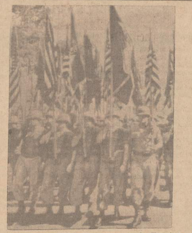
Vietnamo valdžia suruošė didelį kariuomenės parodą diktatoriaus Ngo Dinh Diem nuvertimo dviejų metų sukakties progą. Paradoje pramarysavo įvairių tautų garbės sargybos. Paveiksle matome maršuojančius amerikiečius.

CANBERRA. — Australijoje mirė Herbert Evatt, buvęs australų darbo partijos pirmininkas ir Jungtinių Tautų asamblėjos prezidentas. Jis turėjo 71 metus amžiaus.