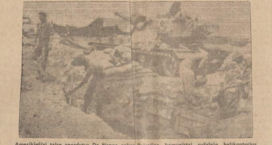
Amerikiečiai taiso apardytus Da Nango apkas Priseline komunistai sužalojo helikopterius.