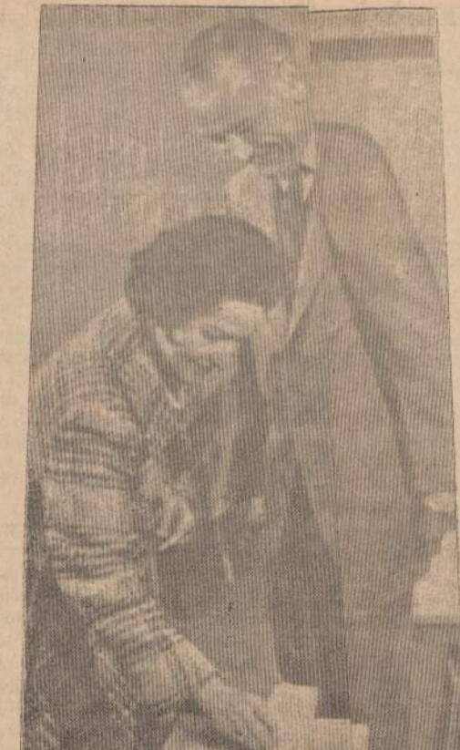
Prezidentas Johnsonas su žmona praeitą antį balsavo Texas valstijoje, Johnson City mieste. Texas gyventojai padarė dešimt esminių pakeitimų savo konstitucijoje. Gojai turėjo progos šiuo reikalu pasisakyti

Will Rogers "Cowboy Philosopher", kuris žuvo lėktuve 1935 m. Jo namai Beverly Hills, San-