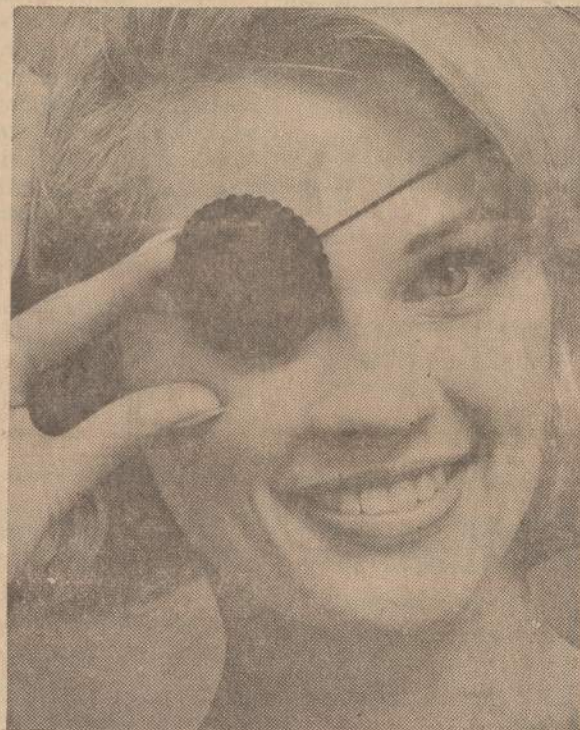
Hollywoodo panos, norėdamos dar labiau patraukti vyrų dėmesį, dabar pradėjo dangstyti vieną aki. Akių lopa yra įvairiausių spalvų. Jūs galite priderinti prie veido odos spalvos.

"NAUJIENOS" KIEKVIENO DARBO ŽMOGAUS DRAUGAS IR BIČIULIS