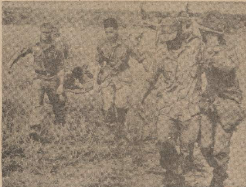
Netoli Saigono įvyko smarkūs susirėmimai tarp JAV marinių ir komunistų. Mariniai sužeistais nešė į helikopterius, kad greičiau patektų į ligonines.

LONDONAS. — Britų medicinos pagalbos komitetas jau išsiuntė į Šiaurės Vietnamą 2,800 vertės vaistų. Jie nupirkti komunistinių organizacijų aukomis.