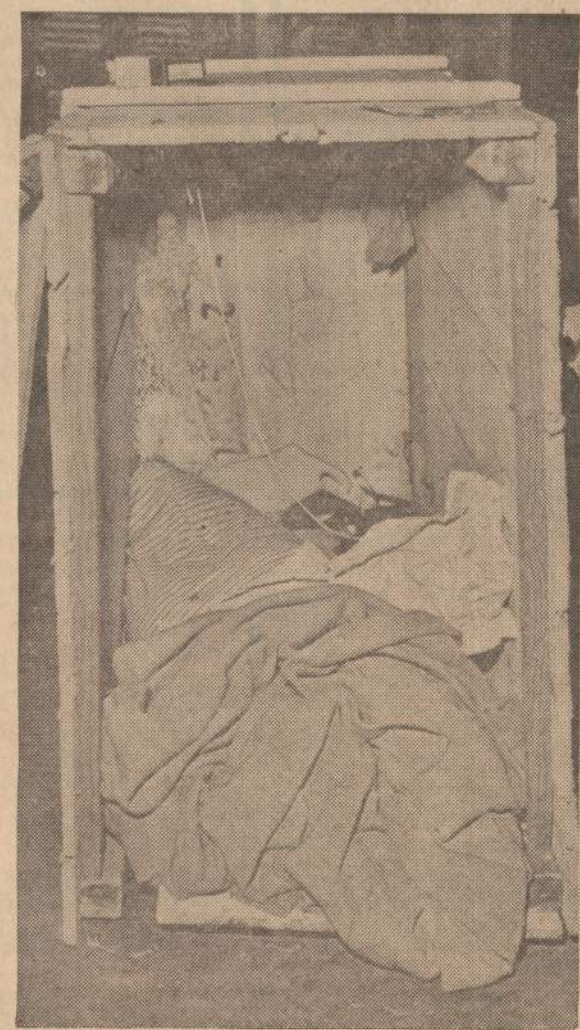
Iš Australijos į San Francisco lėktuvu buvo atsivešta ši dėžė, svėrusi 386 svarus. Kai ji buvo iškelta iš lėktuvo ir padėta į sandėlį, tai už kiek laiko rasta tuščia. Joje rastos storos atklotės ir daug trupinių. Pabėgęs keleivis turėjo būti diktas, nes dėžė svėrė 249 svarais mažiau, negu Australijoje. Policija ieško slapta įvažiuosiu keleivio.