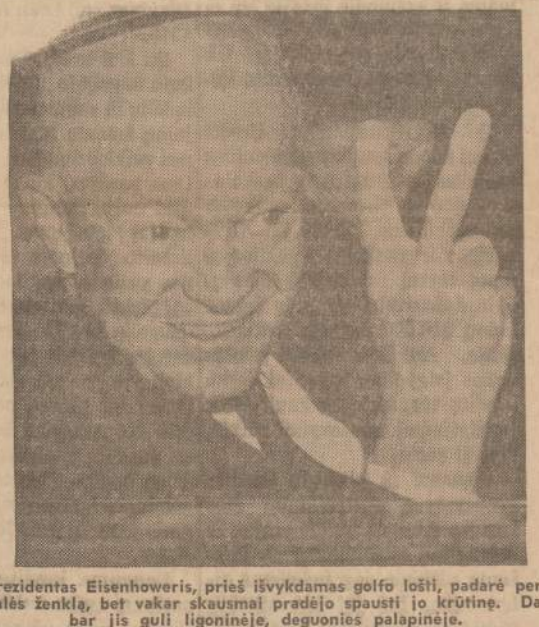
Prezidentas Eisenhoweris, prieš išvykdamas golfo lošti, padarė pergales ženklą, bet vakar skausmai pradėjo spausti jo krūtine. Dabar jis guli ligoninėje, deguonies palapinėje.

Springfielde apskaiciuojama, kad ateinančiais 1966 metais Illinojaus vieškelių fondas turės apie 17.5 milijonų dolerių deficito. Deficitu vadinamas