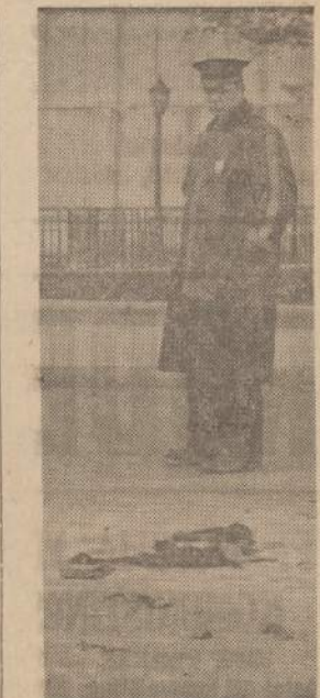
New Yorko policininkas daboja susiginosiu "laiskos šalininko" aikštėje paliktus drabužius.