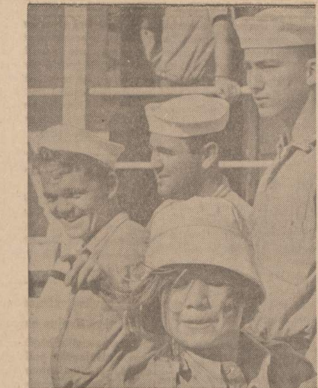
Iš komunistinio rojaus bėgantį kubiėtė tiek pamogės Amerikos juveivius, kad savo atsiminimams pasiėmė vieno kepuratę. Amerikiečiai išgelbėjo mažą laivą plaukiančių Kubos bėgių grupę ir atvežė į Miami, Florida.

HELP STRENGTHEN AMERICA'S PEACE POWER BUY U.S. SAVINGS BONDS