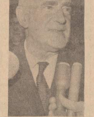
Britų užsienio ministeris Michael Stewart atvyko į New Yorką, kur saugumo taryba svarstys Rodezijos klausimą.

♦ JUNEAU. — Į Alaskos uostą atplaukė rusų prekinis laivas “Ivan Kulibin”, kurį audra smarkiai apdaužė netoli Alaskos krantų.