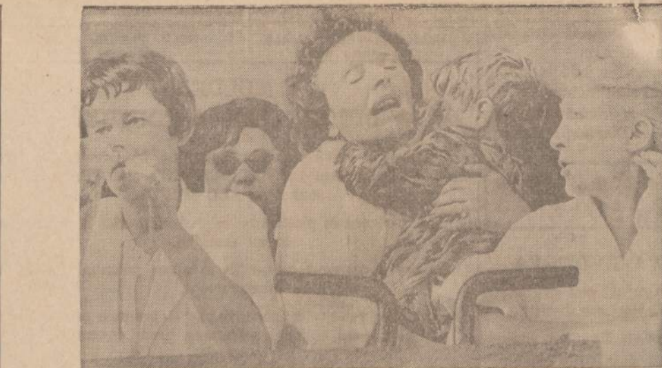
"Bahama Star" atvežė į Nassau uostą iš vandens ištrauktus "Yarmouth Castle" keleivius. Kilus gaisrui, daugelis keleivių užtroško ir negalėjo išeiti ant denio. Išsigelbėjusieji laivo igulus narijai tardomi. Vyriausybė nori išaiškinti gaisro priežastis.

GERBIAMAS NAUJIENU PRIETELI PAAUKODAMAS NAUJIENU MAŠI NU FONDUI, ATLIKSI DIDELI IR GARBINGĀ DARBA. KIEKVIENA DIDELĖ AR MAŽĀ AUKA BUS TĪN KAMAI ĮVERTINTA.