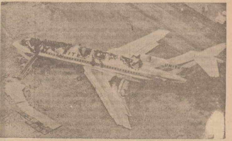
Didelis keleivinis United Airlines lėktuvas, nusileisdamas Salt Lake City aerodrome, užsėdėję sužudo. Zuvo 40 keleivių. Afsakomingi pareigūnai tyrinėja nelaimės priežastis.

Prancūzai, iš tiesų, gresė žiaurais pilietinio karo pavojus, kai nuo jos atsiskyrė Alžėriaus ir Maroko provincijos.