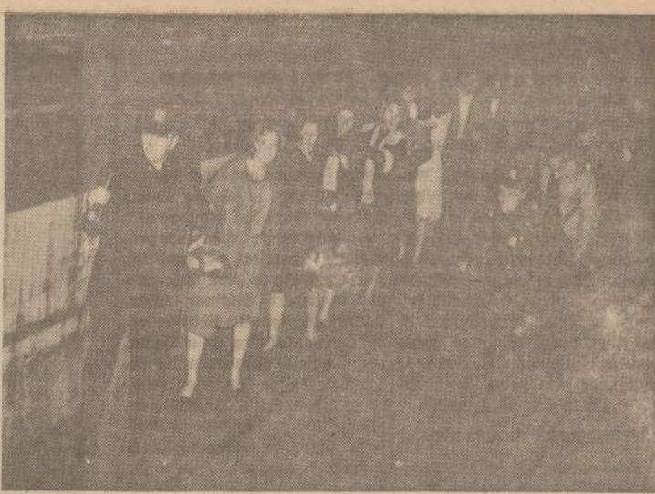
Tamos metu New Yorko policininkai išrikiavo požeminio traukinio keleivius vienon eilėn, lėpė laikytis ir sekti. Šitokiu būdu buvo išvesti šimtai keleivių.

Antra, Švedija išvengė abiejų didžiųjų karų. Tiek pirmajame, tiek antrajame pasauliniame