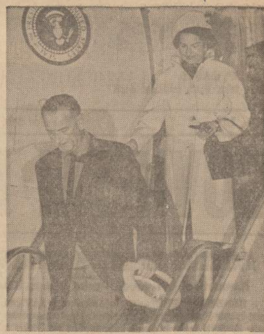
Prezidentas Johnsonas ir jo žmona iš Texas ūkio praeitą pirmadienį atskrido į Washingtoną, kur planuoja prabūti iki ketvirtadienio. Trečiadienį Baltuose Rūmose vakarienių ir bus prezidento svečiai britų princesė Margarita ir jos vyras. Prezidentas jau sustiprėjo po operacijos, bet jis tvirtina, kad prapietautoje vietoje jis dar jaučia skausmą.