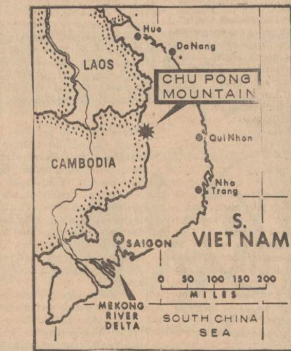
Chu Pong kalnų pašlaitėje, visai netoli Laoso sienos, amerikiečiai nušlavė visą šiaurės Vietnamo batalijoną. Kovos lauke komunistai paliko 1,200 lavonų. Sekmadienį prasidėjusios kovos pasibaigė tik-tai antradienį. Priešas nepajėgė atsikurti prarastų pozicijų.

Saigone karinė vadovybė leidžia spaudos atstovams pasikalbėti su trim neseniai belaisvėn paimtais šiaurės Vietnamo kareiviais. Jie papasakojo, kad Kinija ne tik duoda paramą šiaurės Vietnamui, bet jį kariniškai vadovauja vietnamiečių kareiviams. Šiaurės Vietnamo daliniai atvykę per Kambodiją. Čia kariuomenė ir milicija kareiviams teikdavusi maistą ir kitaip padėjusi. Belaisviai papasakojo, jog komunistų propaganda skelbia, jog Pietų Vietnamas yra beveik visiškai komunistų rankose. Kareiviams sakoma, kad tik vieni amerikiečiai norį karo, o Pietų Vietnamo gyventojai laukia išvadavimo iš amerikiečių okupacijos.