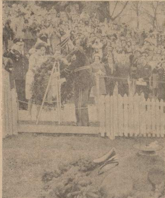
Britų princesė Margarita dėdą gėlių vainiką ant prezidento John F. Kennedy kapo Washingtono kapinyne.

Kalbėdamasis su spaudos atstovais ministeris pareiškė, kad jam būtų daug lengviau eiti pareigas, jei jis žinotų, kad per kelis metus Amerikos kviečiai bus siunčiami Indijon. Trumpalaikiai susitarimai pareikalauja daug laiko, jam reikia rūpintis įvairiomis maisto kortelėmis, suvaržymais, paskirstymu. Laiko nelieta rūpintis žemės ūkio pagerinimu, trąšomis, drėkinimu ir parazitų naikinimu.